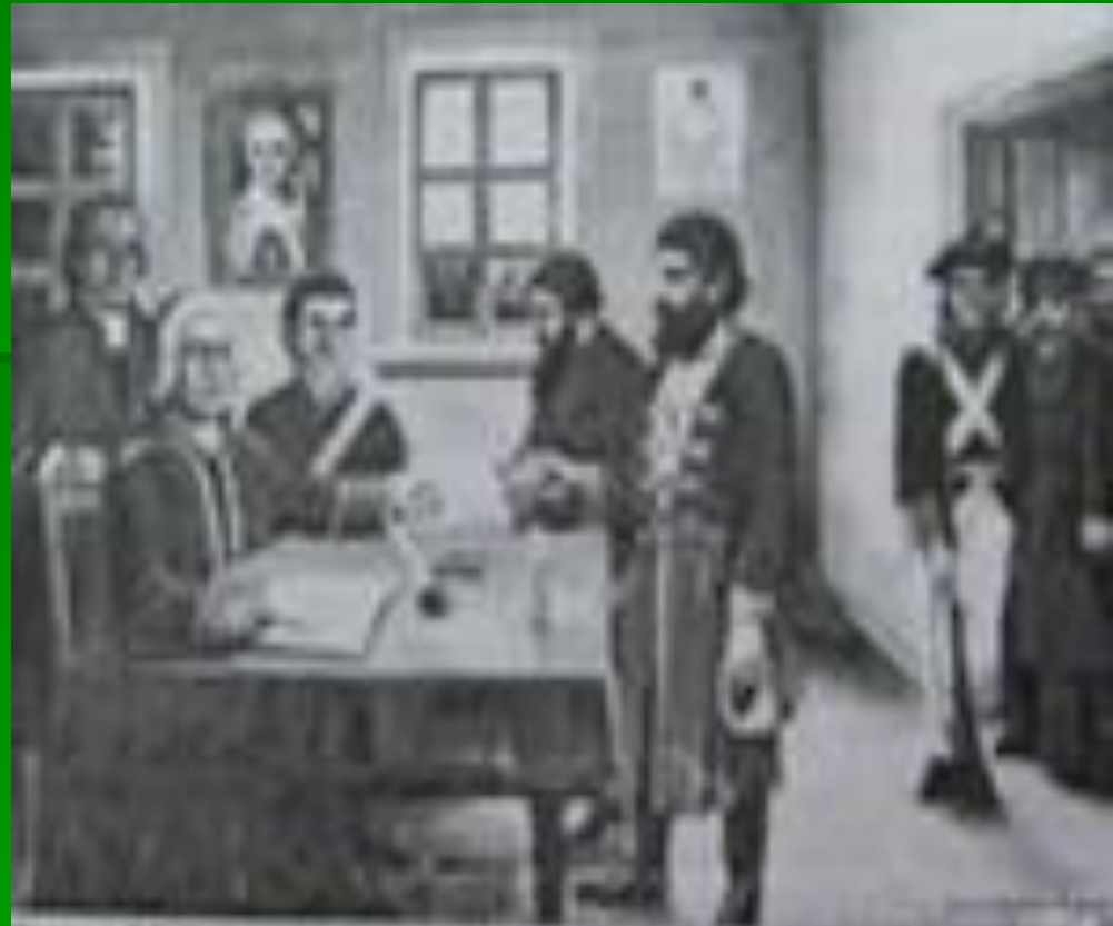
В.И. Суриков. Пугачев на военном совете. 1881 г. Музей-квартира А.С. Пушкина, Санкт-Петербург.

Портрет Пугачева на военном совете Пушкин дает в окружении соратников из казацких старшин.