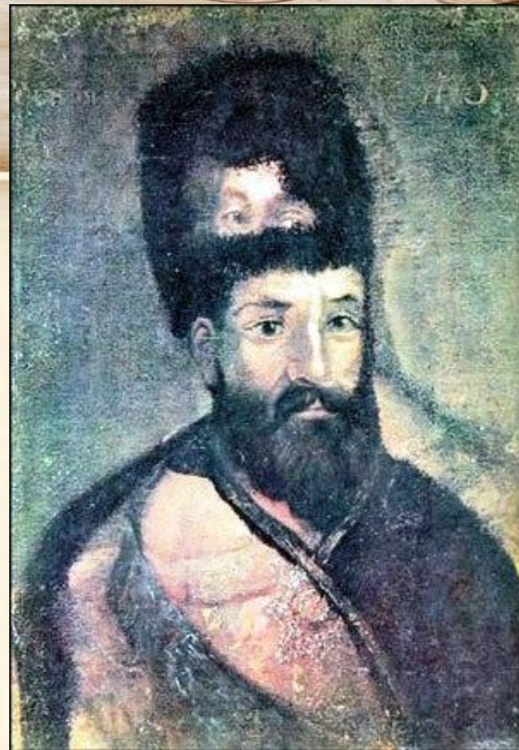
Портрет Пугачёва, написанный неизвестным художником на портрете Екатерины II.