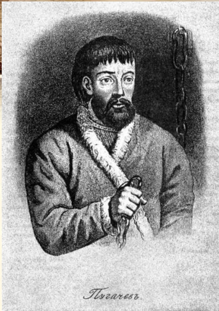
Портрет Пугачёва, приложенный А.С. Пушкиным к изданию 1834 г.