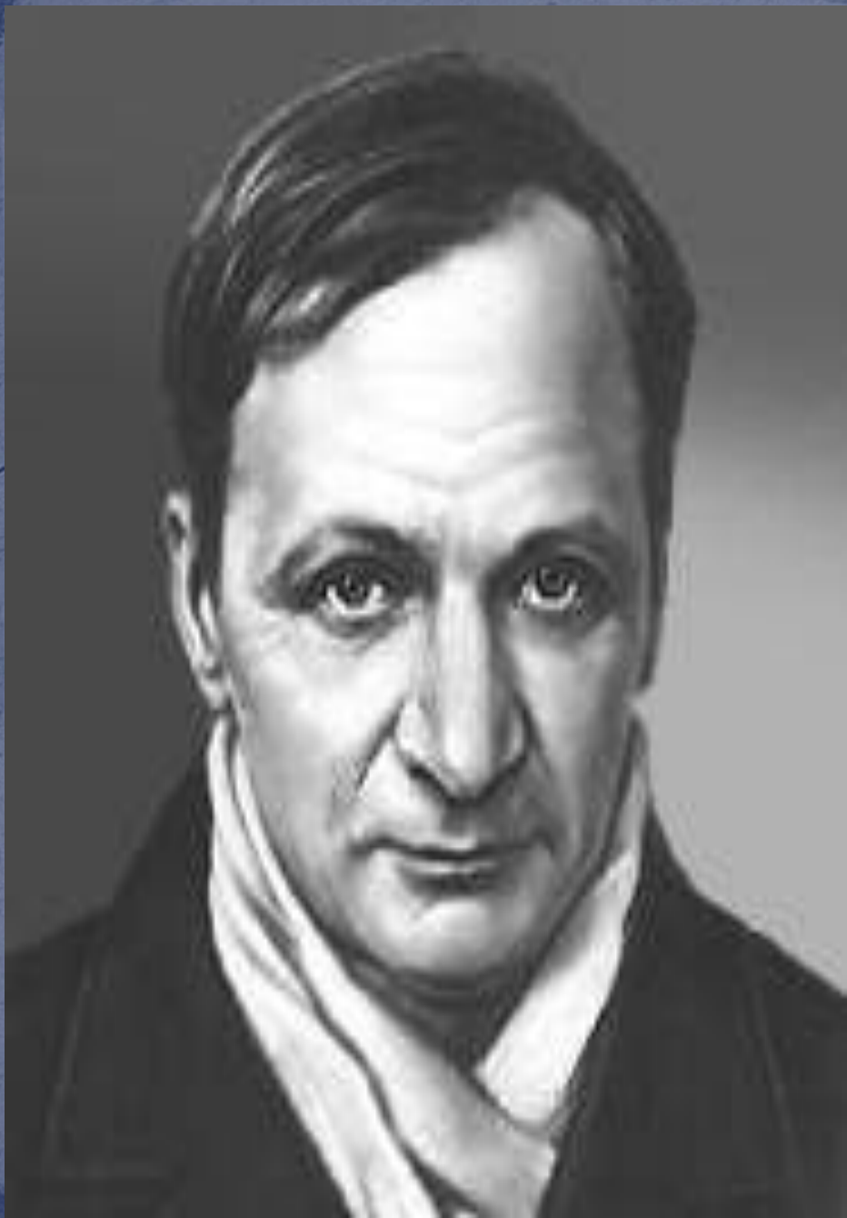
Андрей Платонович Платонов