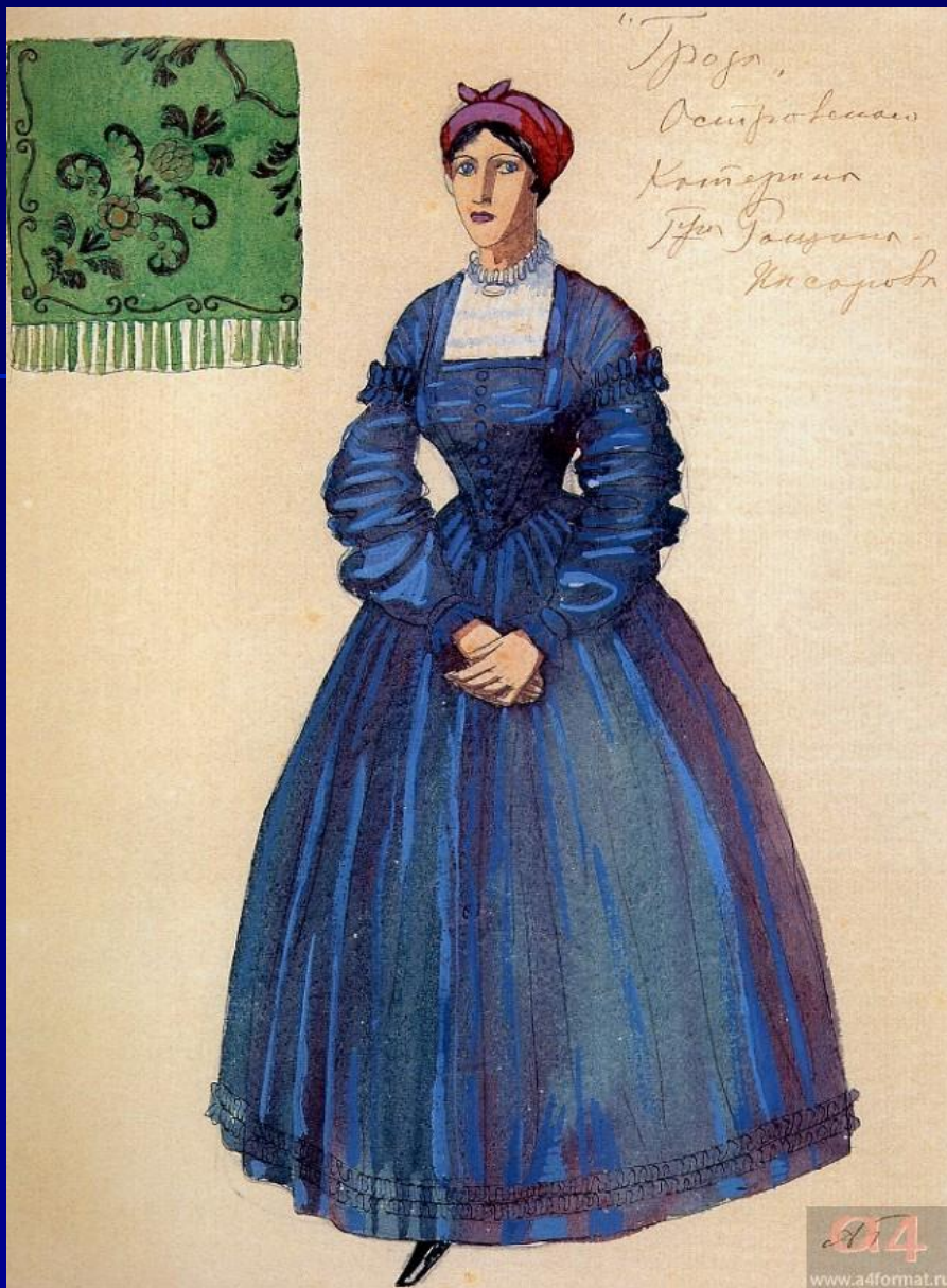
А. Головин «Катерина»

Катерина не может жить дальше со своим грехом. Она признается во всем мужу и свекрови. Но покаянию должно сопутствовать смирение, а его нет в свободолюбивой героине. Самоубийство — страшный грех, но именно на него решается Катерина, будучи не в силах существовать в мире, где люди не летают, как птицы.