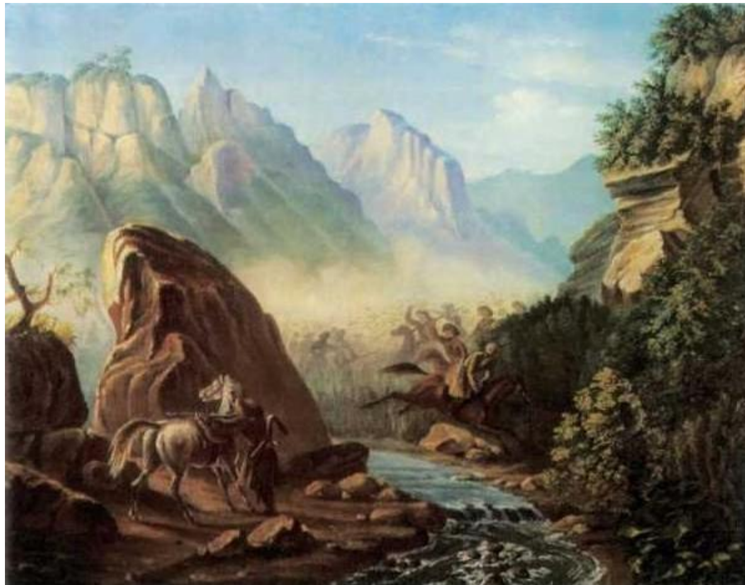
Перестрелка в горах Дагестана. Масло. 1840-1841