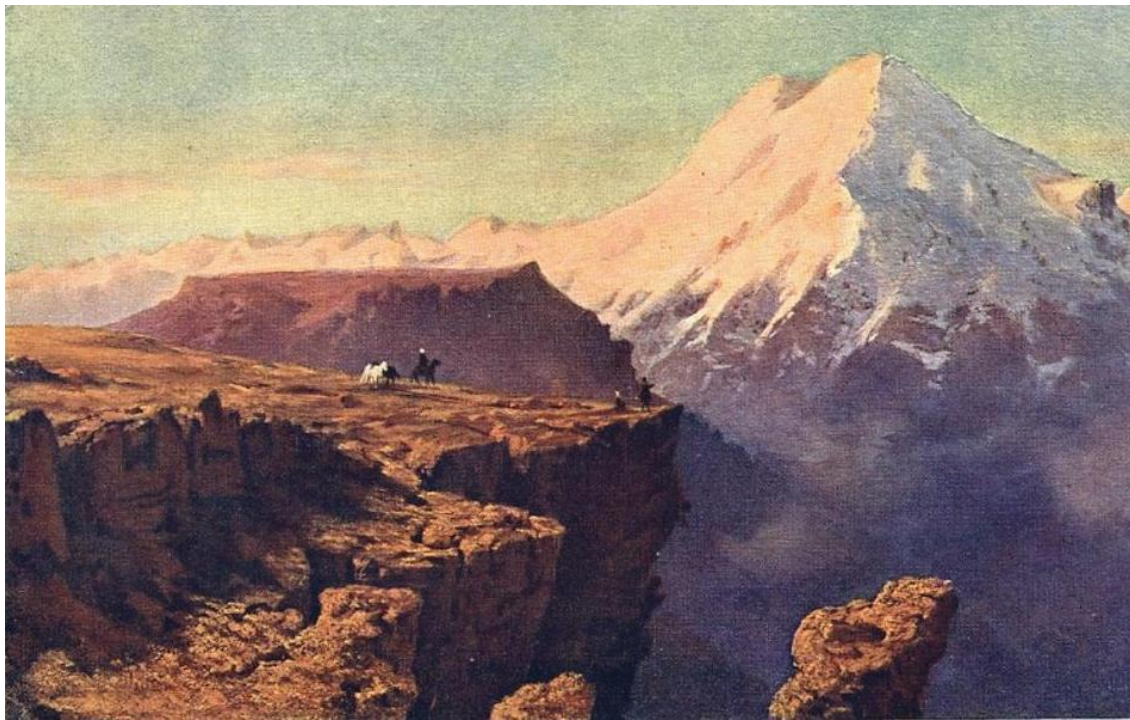
Кавказский вид с Эльбрусом.