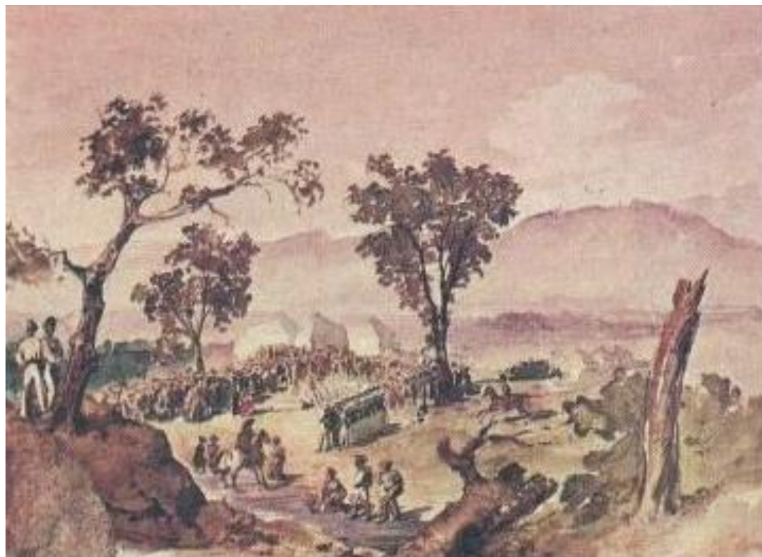
При Валерике. Похороны убитых. Акварель. 1840