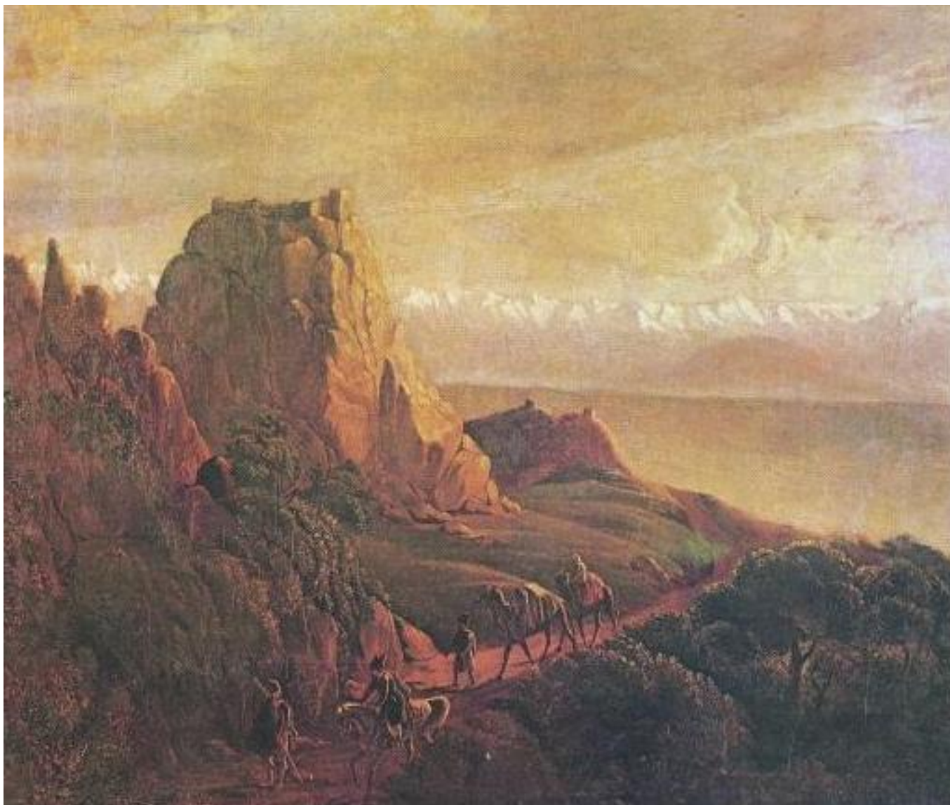
Окрестности селения Караагач. Масло. 1837-1838