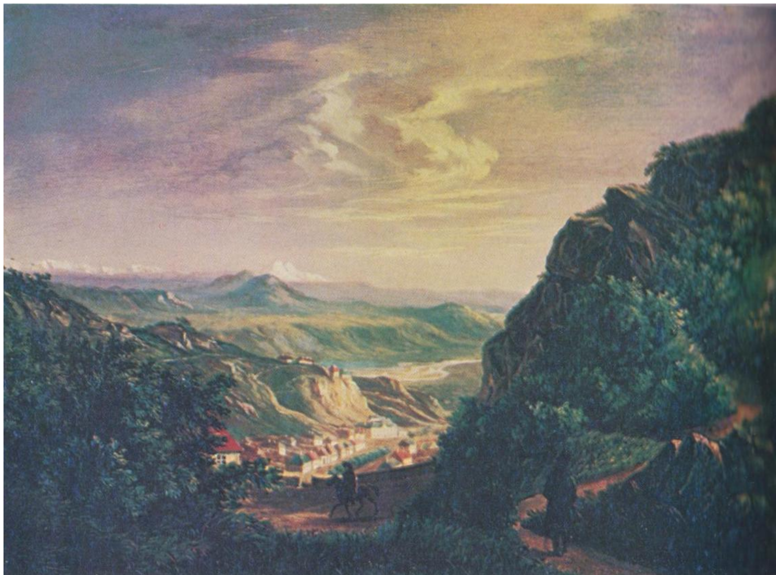
Вид Пятигорска. Масло. 1837