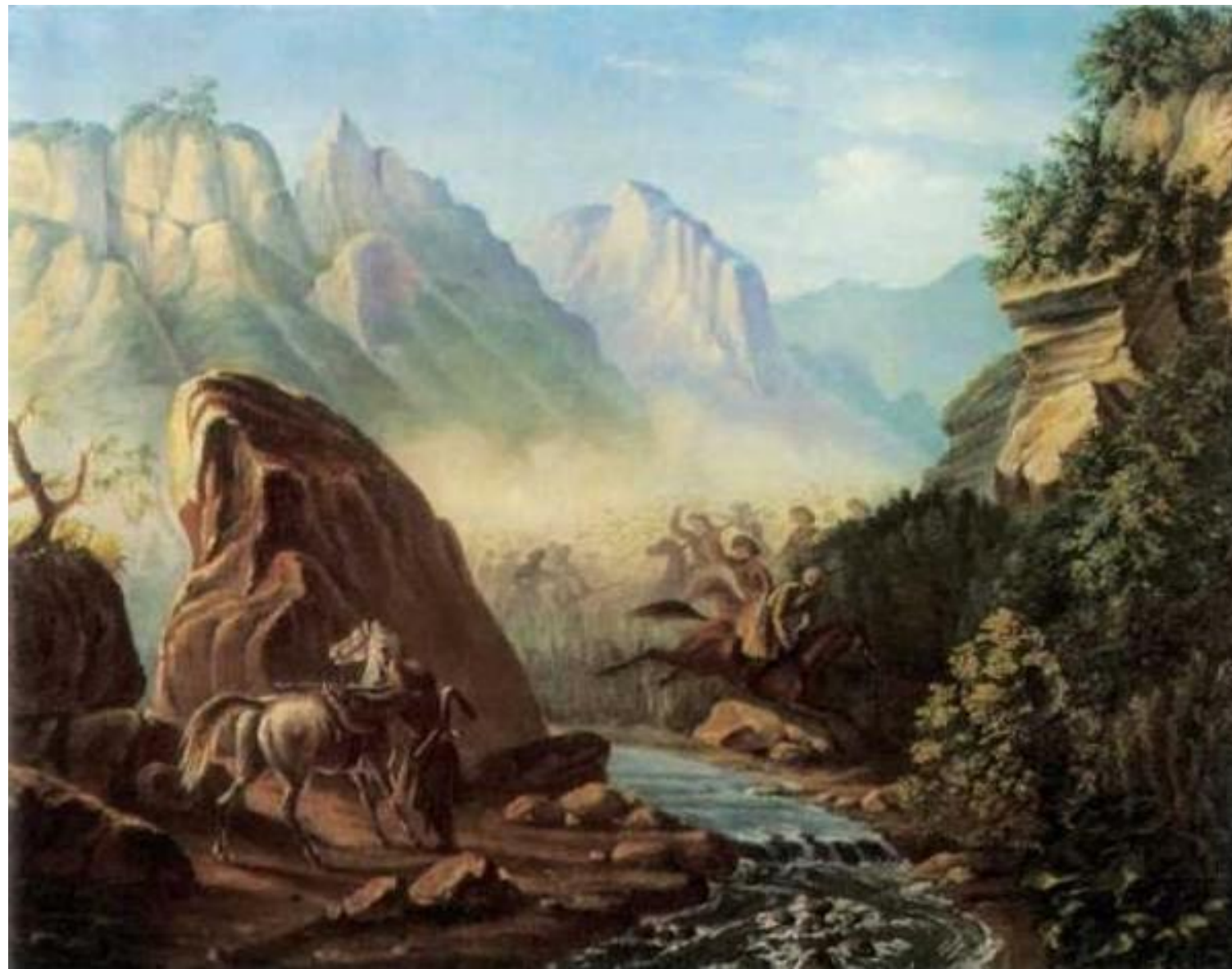
Перестрелка в горах Дагестана. Масло. 1840-1841