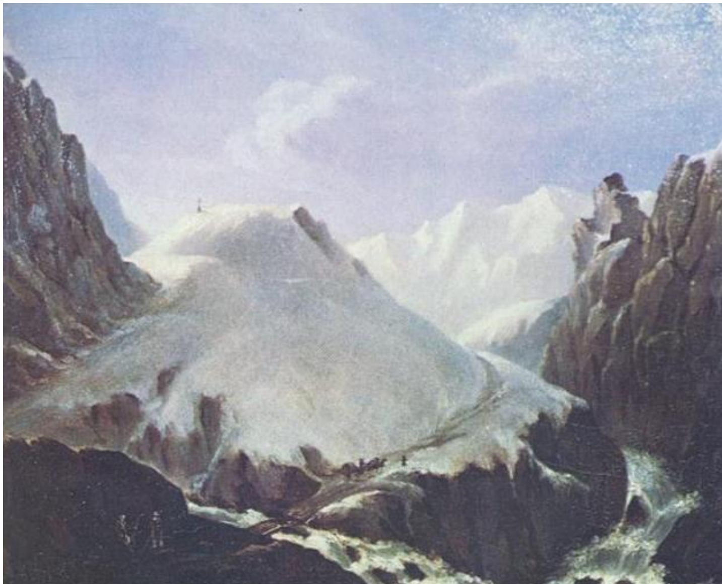
Крестовый перевал. Масло. 1837-1838