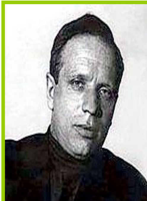
Александр Андреевич Прокофьев (1900-1971)