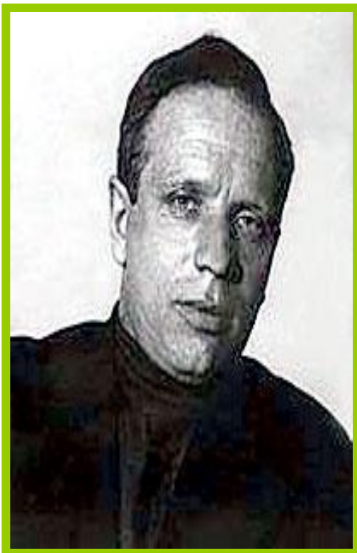
А. А. Прокофьев (1900-1971)