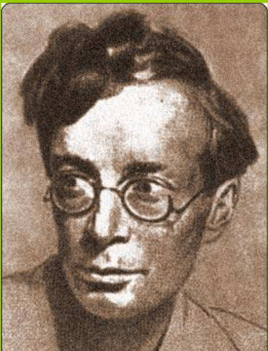
Дмитрий Борисович Кедрин (1907-1945)