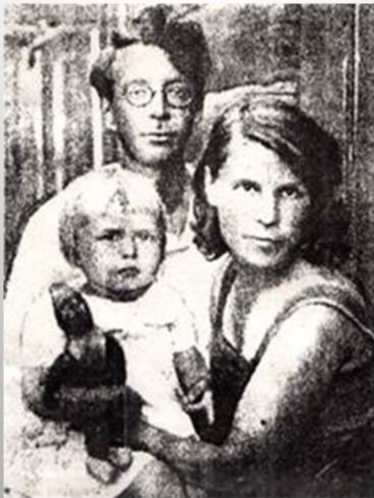
Дмитрий Кедрин с женой и дочерью Светланой, которая стала поэтессой, литературоведом, переводчицей.