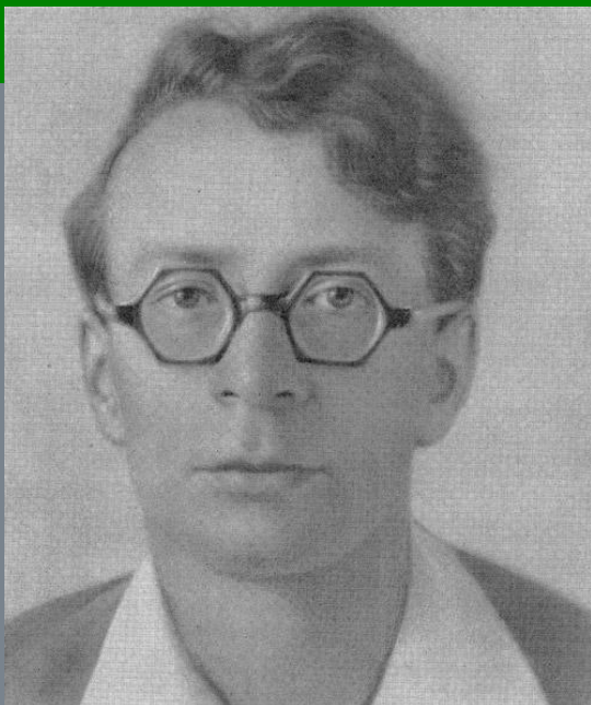
Кедрин Дмитрий Борисович (1907-1945)