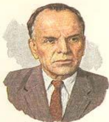
Русский советский писатель Н. Г. ПАУСТОВСКИЙ 1892—1968