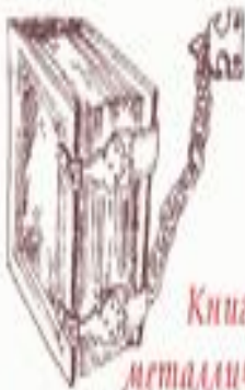
Книга с металлическими застежками

У истоков русской детской литературы Первые печатные книги на Руси