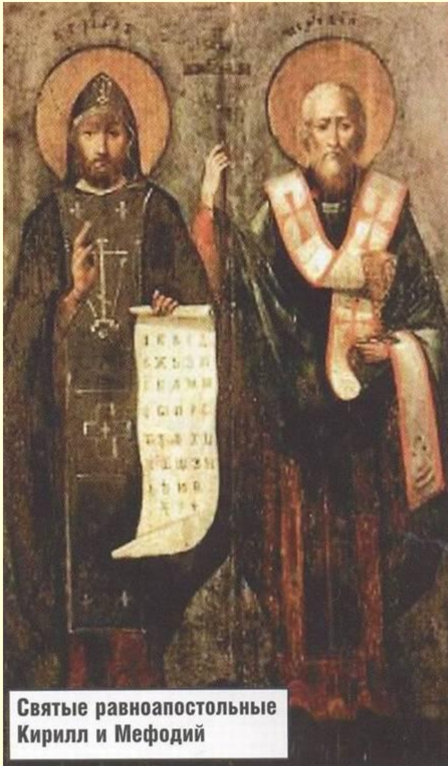
Святые равноапостольные Кирилл и Мефодий