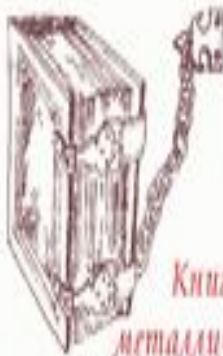
Книга с металлическими застежками

У истоков русской детской литературы Первые печатные книги на Руси