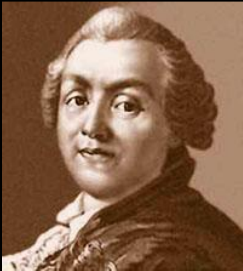
Д. И. Фонвизин.