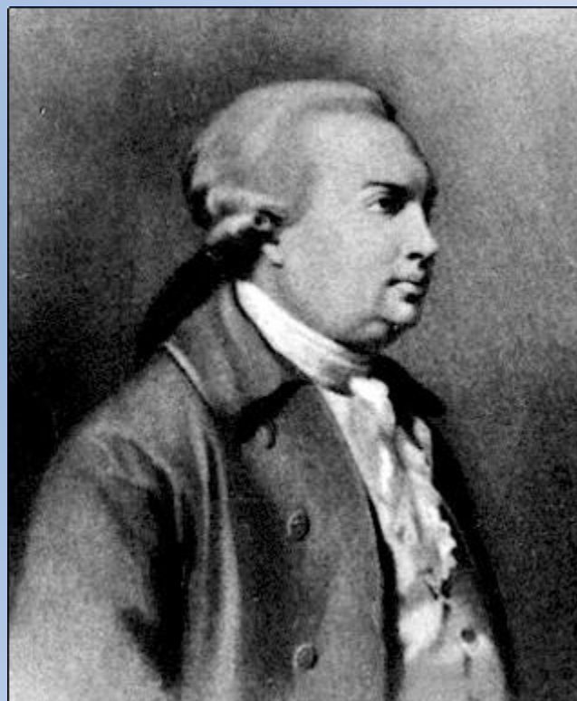
Неизвестный художник 18 века