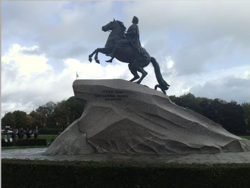
Этьен-Морис Фальконе. Памятник Петру Первому

Как вы думаете, что в скульптуре Петра Великого символизируют: