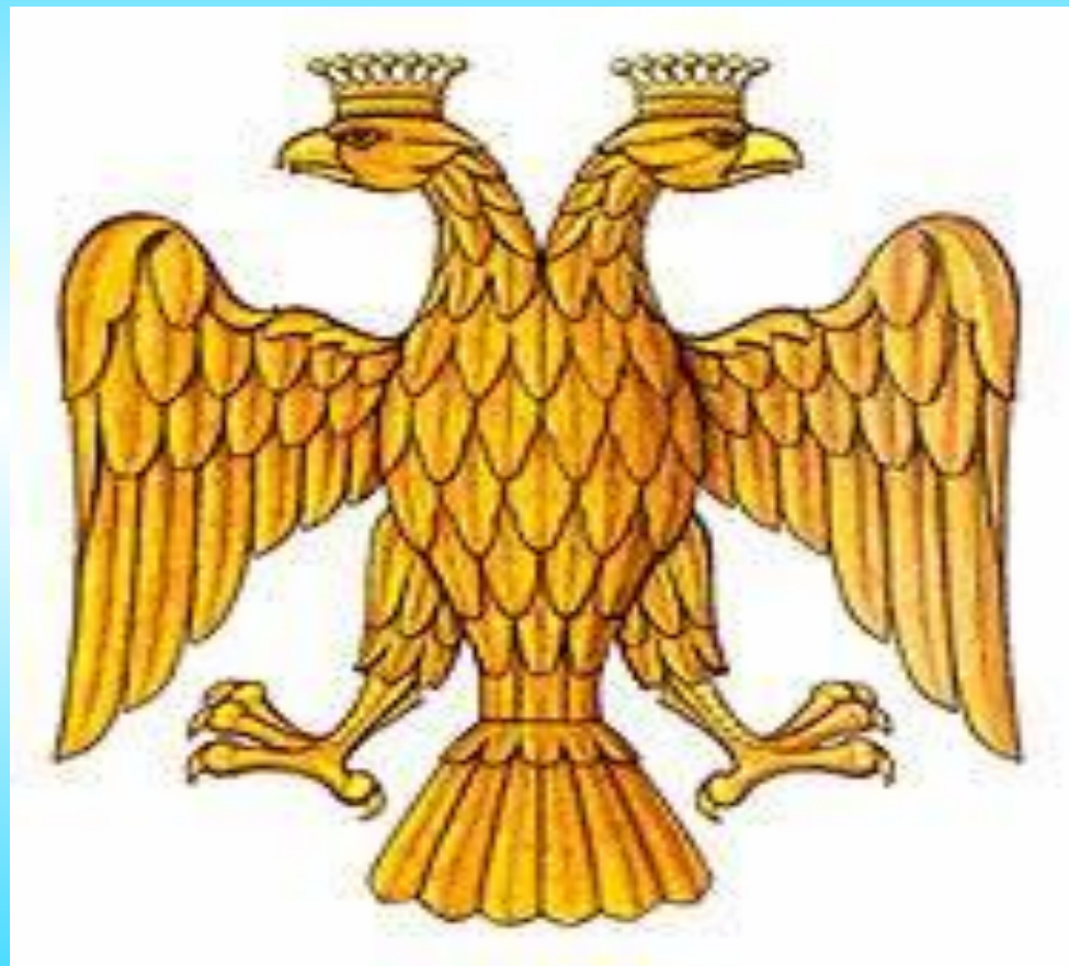
Герб Московского царства при Иване III