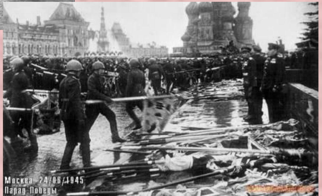
Москва 24/06/1945 Парад Победы