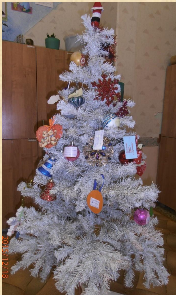
3 – б класс