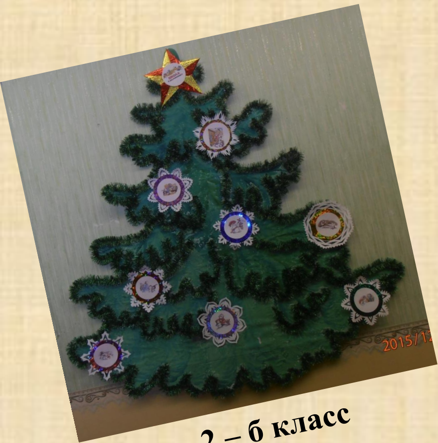
2 – б класс