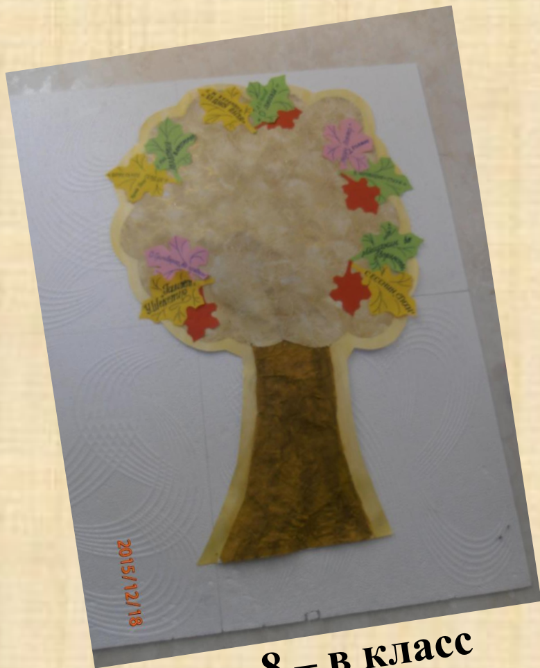
8 – в класс