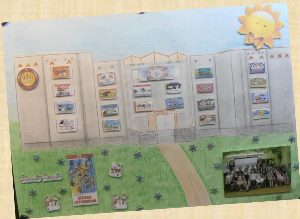
2 – а класс