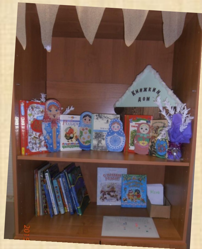
2 – в класс