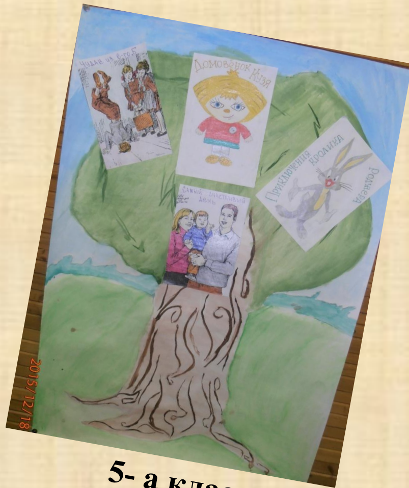
5- а класс