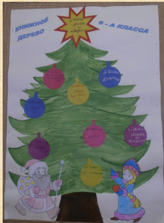
6 – а класс