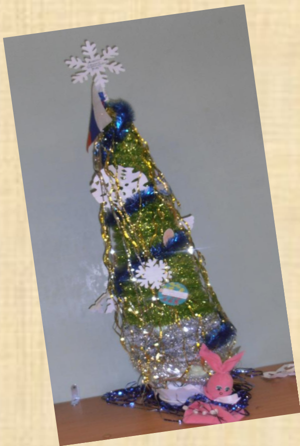
5 – В класс