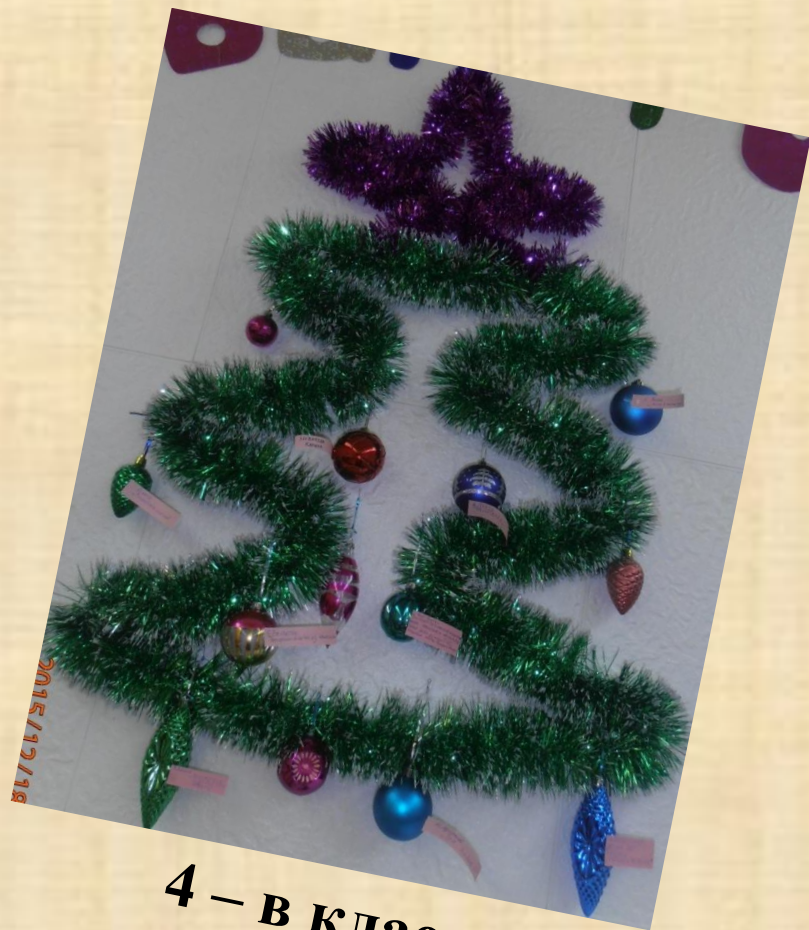
4 – в класс