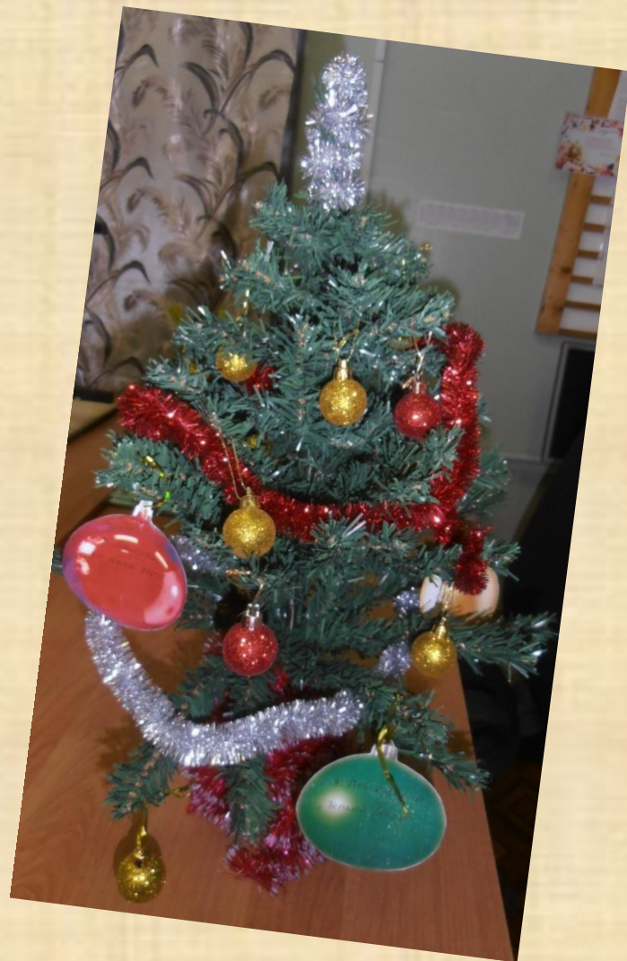
5 – б класс