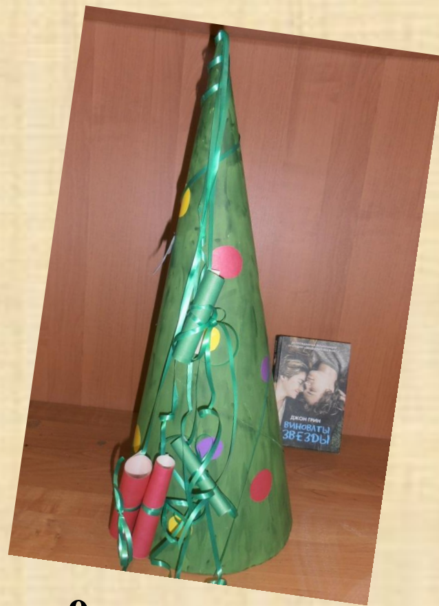
9 – В класс