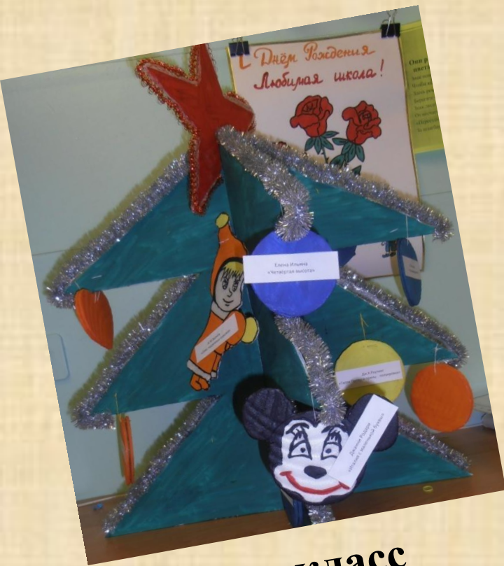
4 – а класс