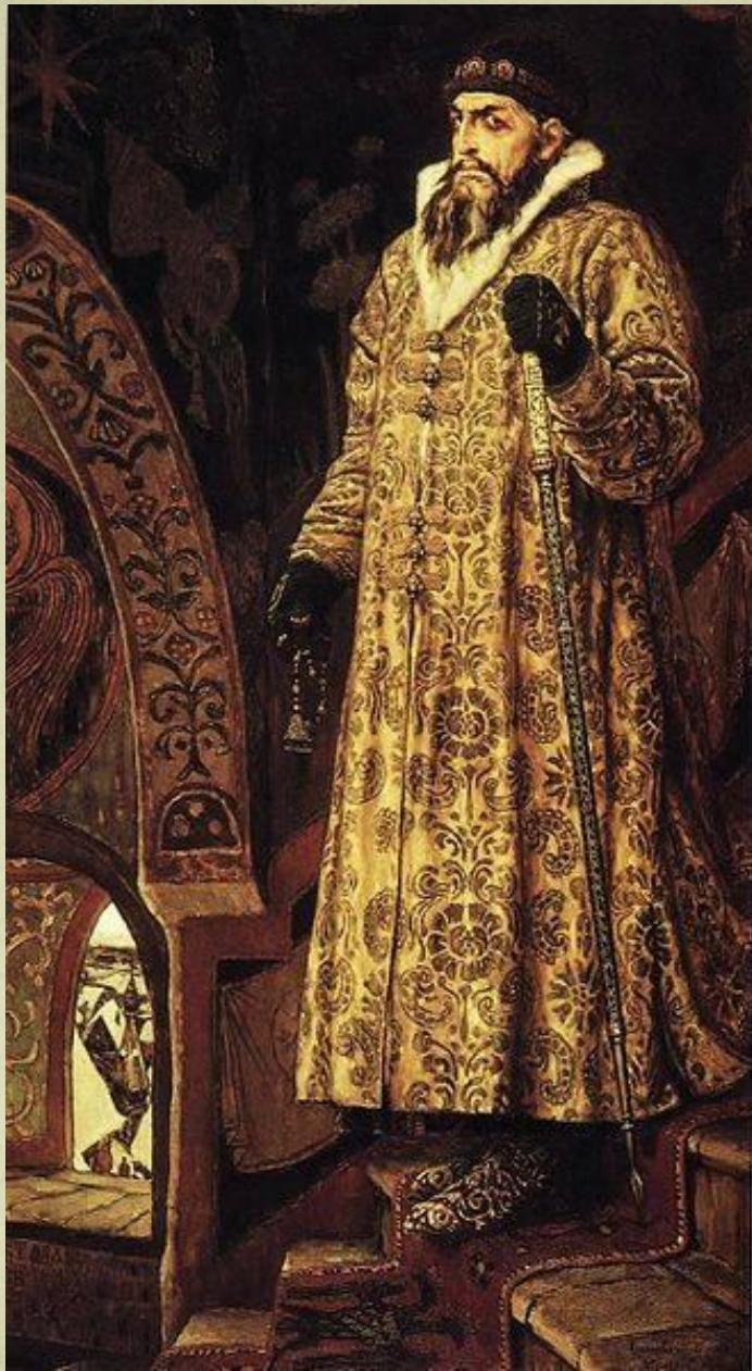
В.М.Васнецов. «Царь Иван Грозный» (1530-1584)