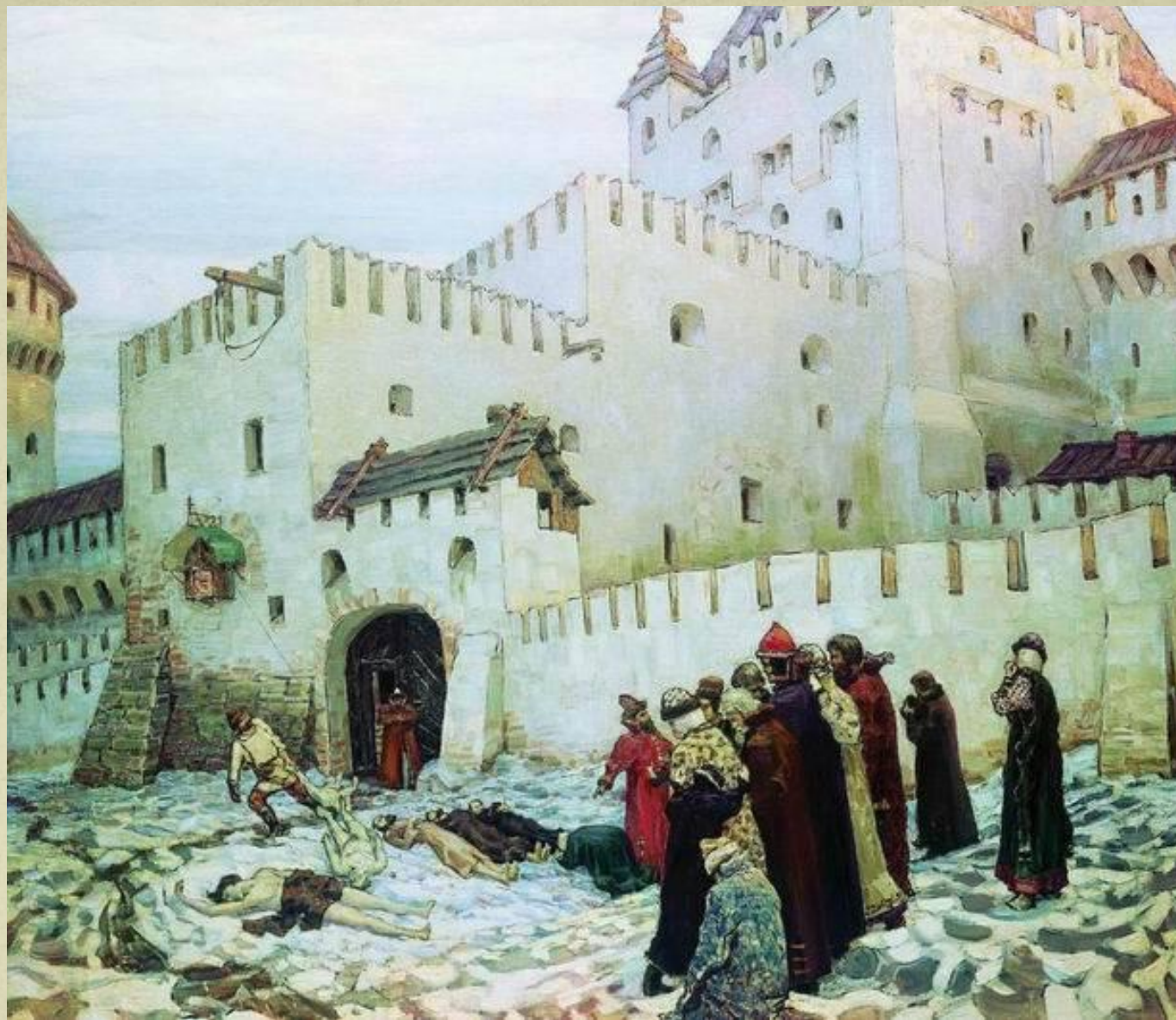
А.М.Васнецов. «Константино-Еленинские Ворота. XVI век.»