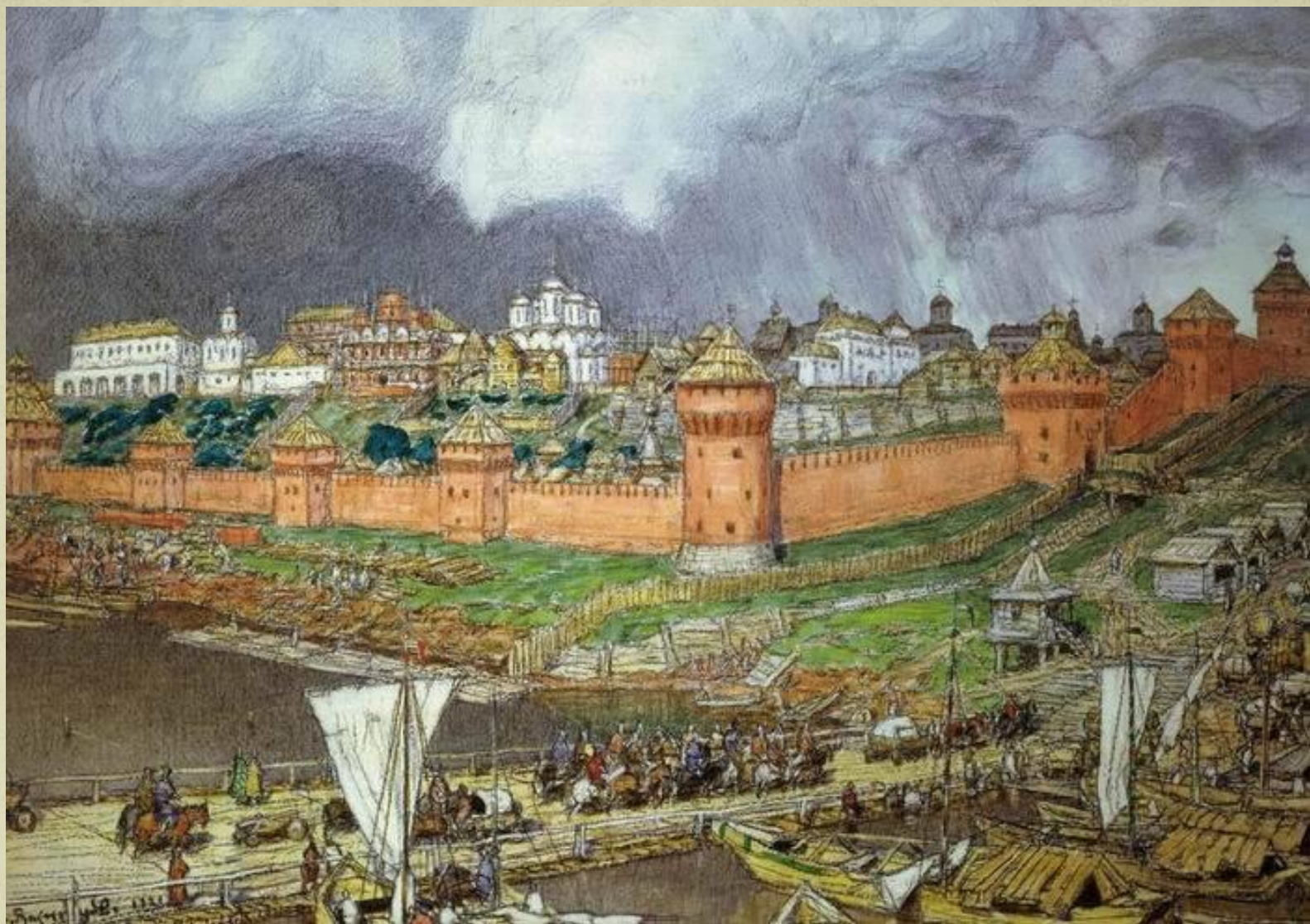
А.М.Васнецов. Кремль, XVI век.