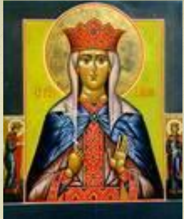
Святая Великомученица Елена