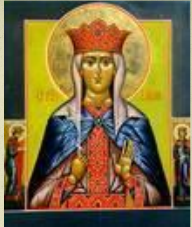
Святая Великомученица Елена