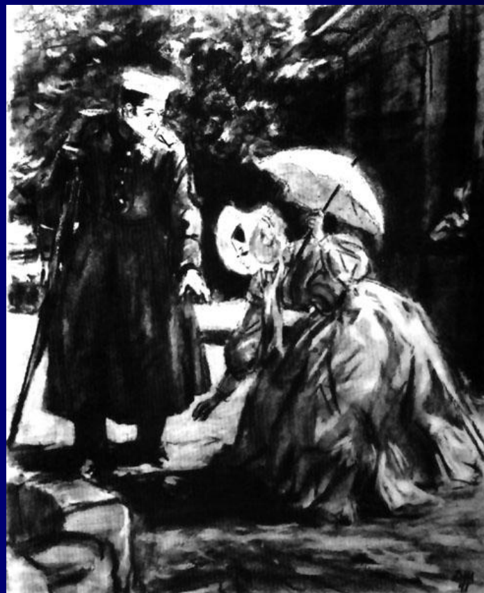
Княжна Мери и Грушницкий