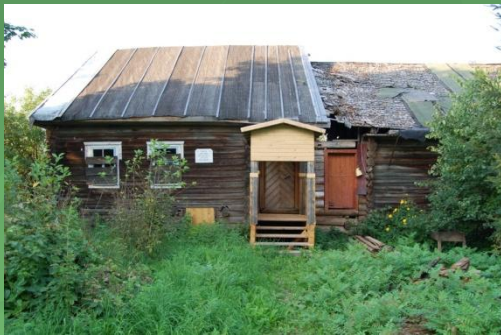
Дом писателя в д.Михеево