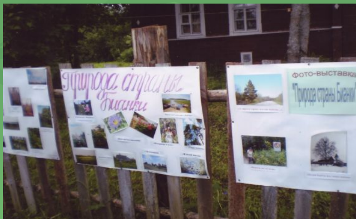
Наши работы на выставке