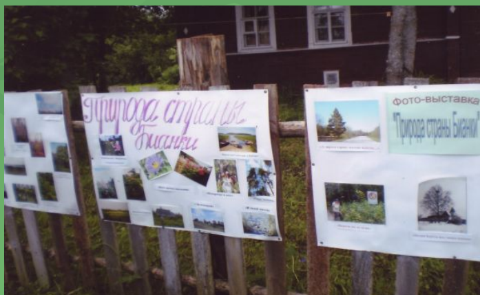
Наши работы на выставке