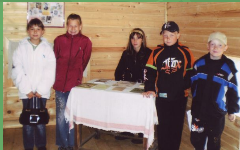
В доме писателя. 2009 г