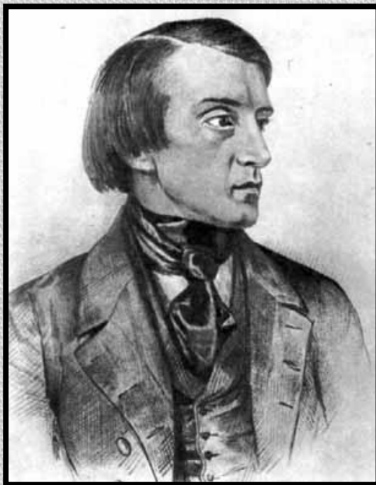
В. Г. Белинский