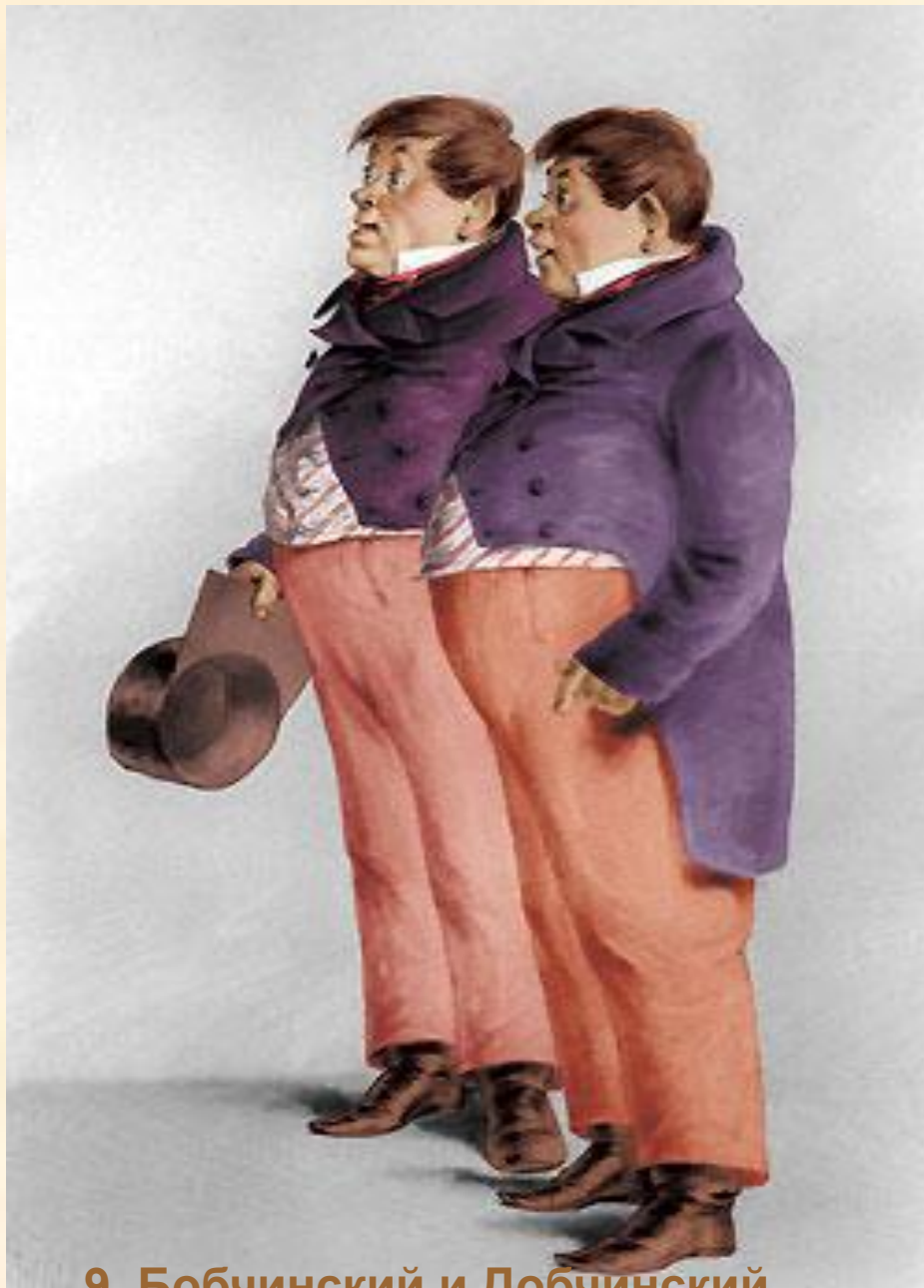
9. Бобчинский и Добчинский