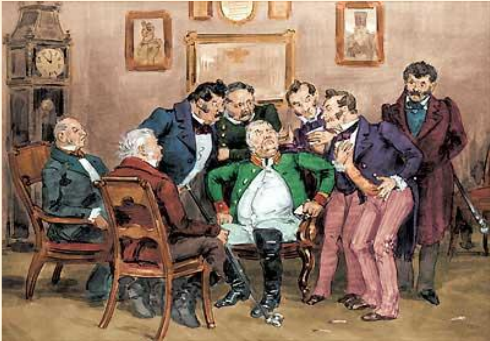
17. Чиновники обсуждают письмо Хлестакова