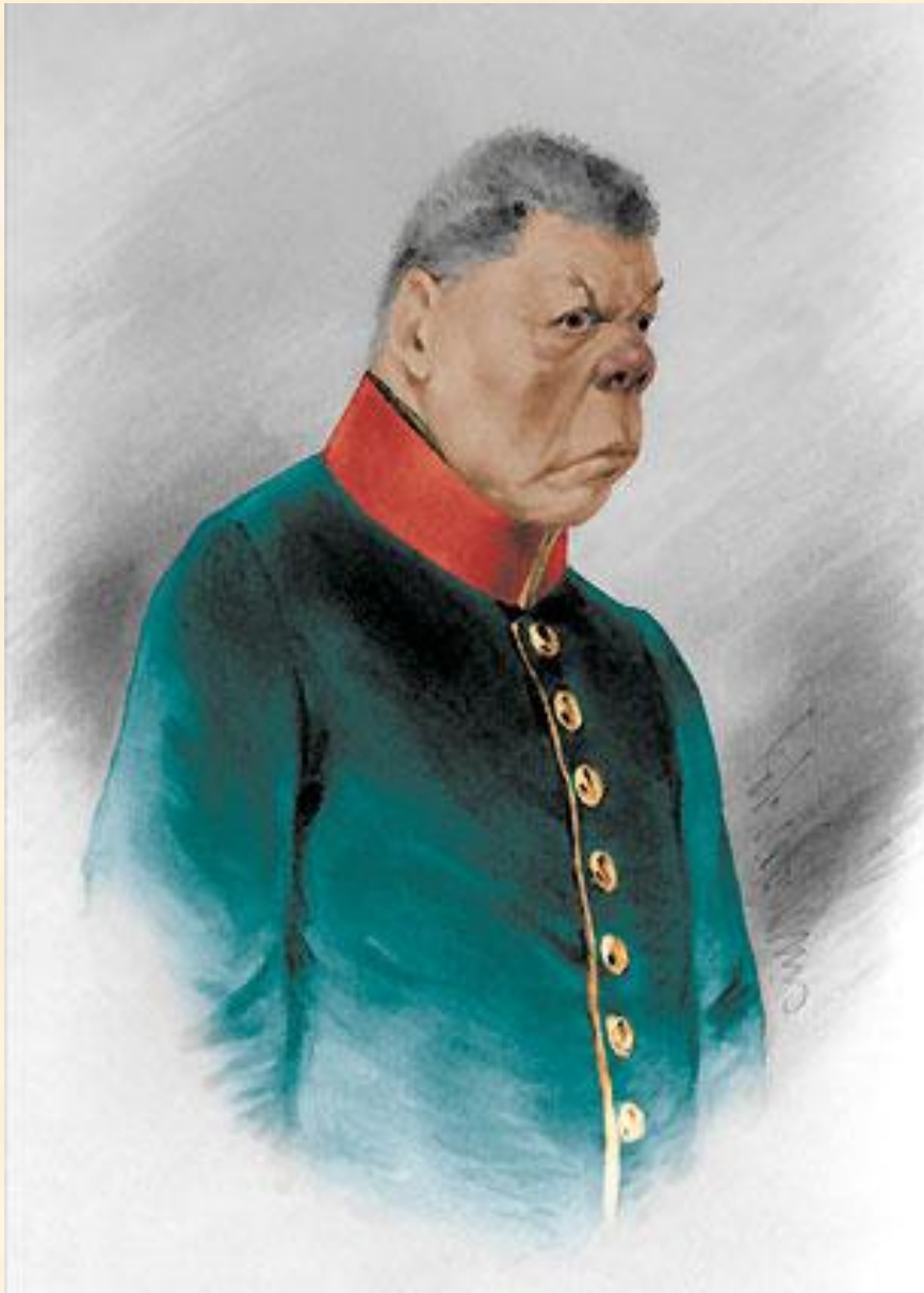
11. Держиморда, полицейский