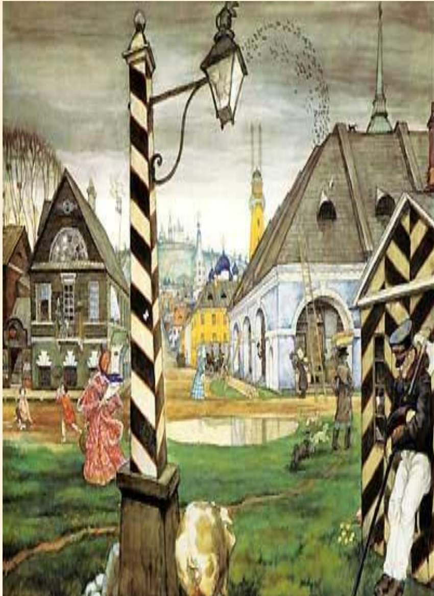
2. Провинциальный город