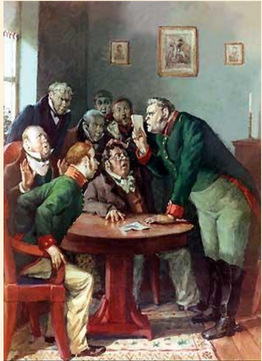
3. Завязка комедии