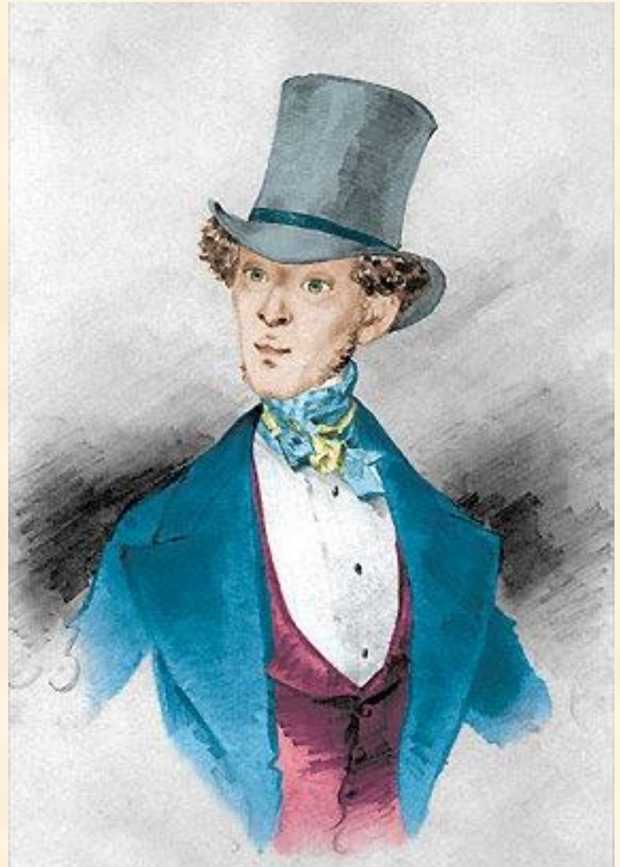
12. Иван Александрович Хлестаков, чиновник из Петербурга.