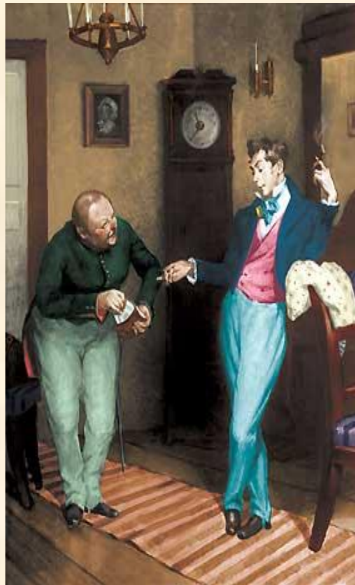
14. Хлестаков и Земляника