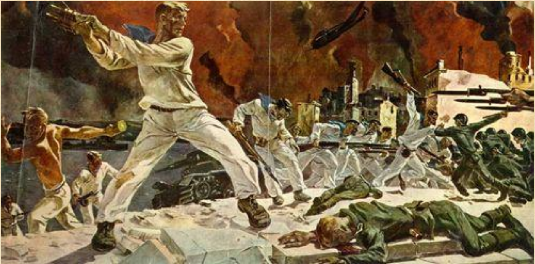
А. А. Дейнека. «Оборона Севастополя». 1942.