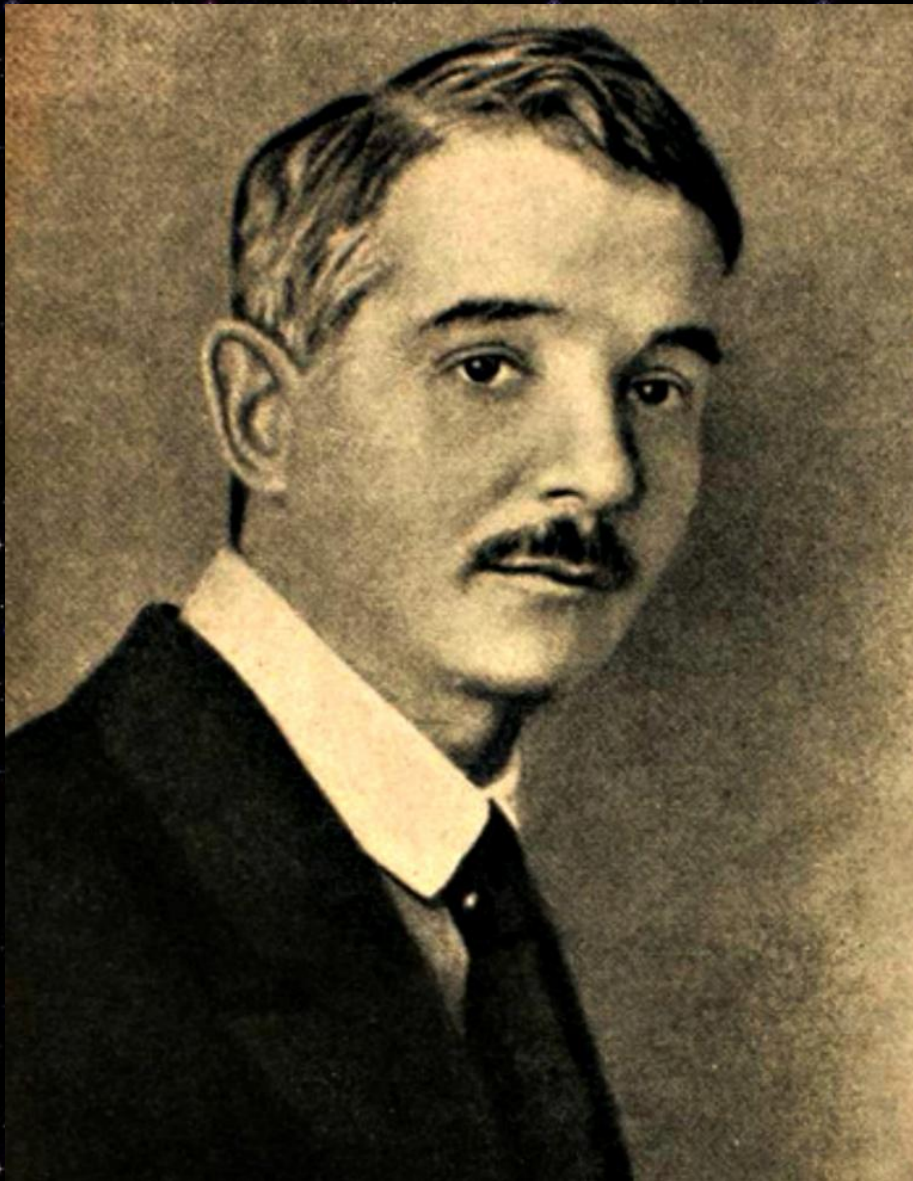
Саша Чёрный (1880 – 1932) (Александр Михайлович Гликберг)