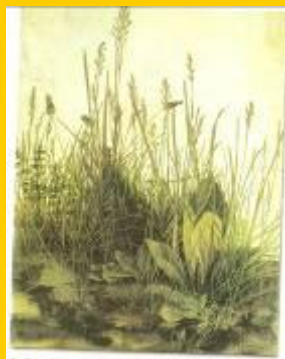
Андрей ДЮРЕР. Трава