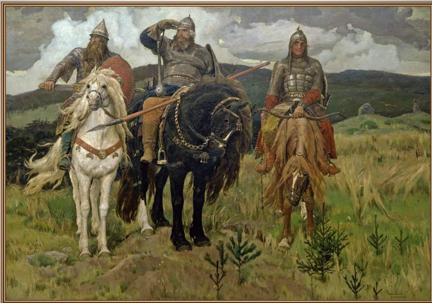
«Богатыри» В.Васнецов (1881-1898)