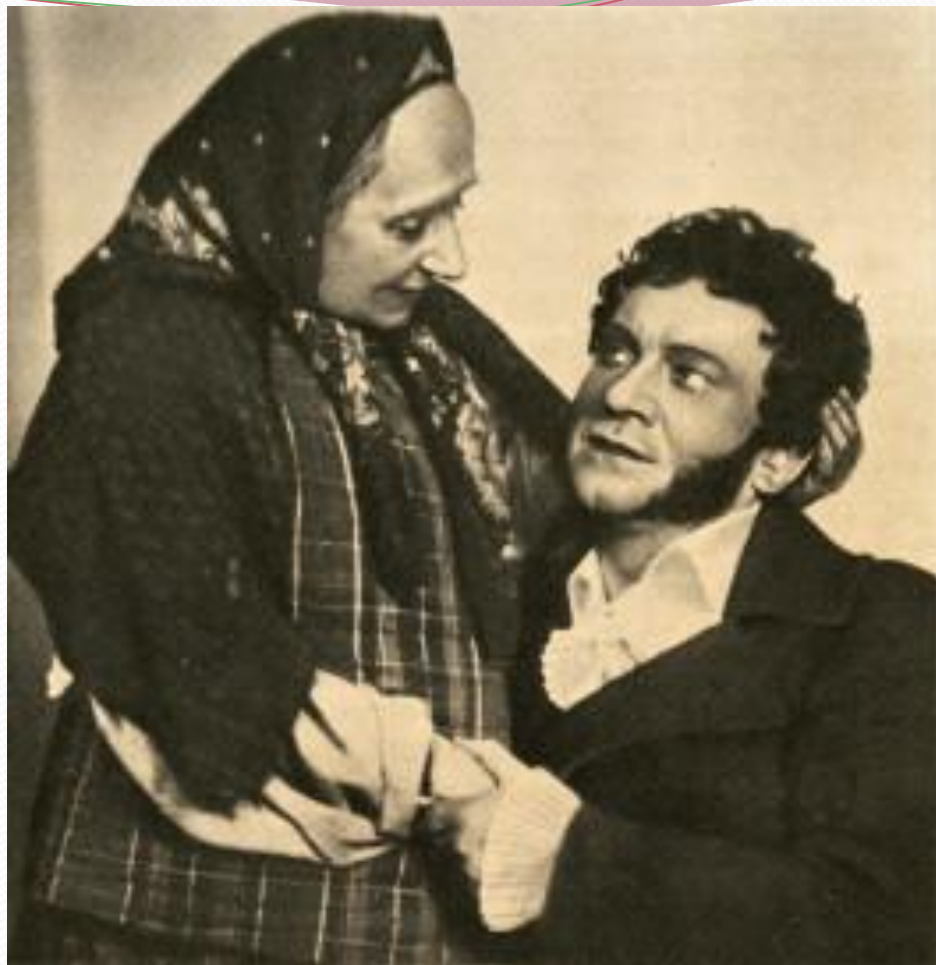
Арина Родионовна – няня Пушкина