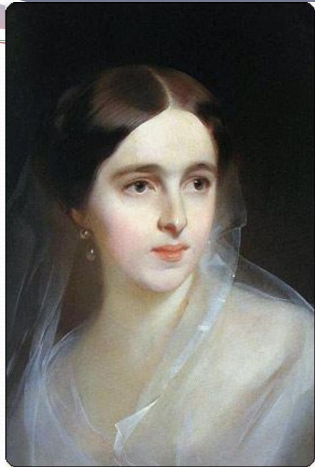
Наталья Гончарова – красавица-жена Пушкина