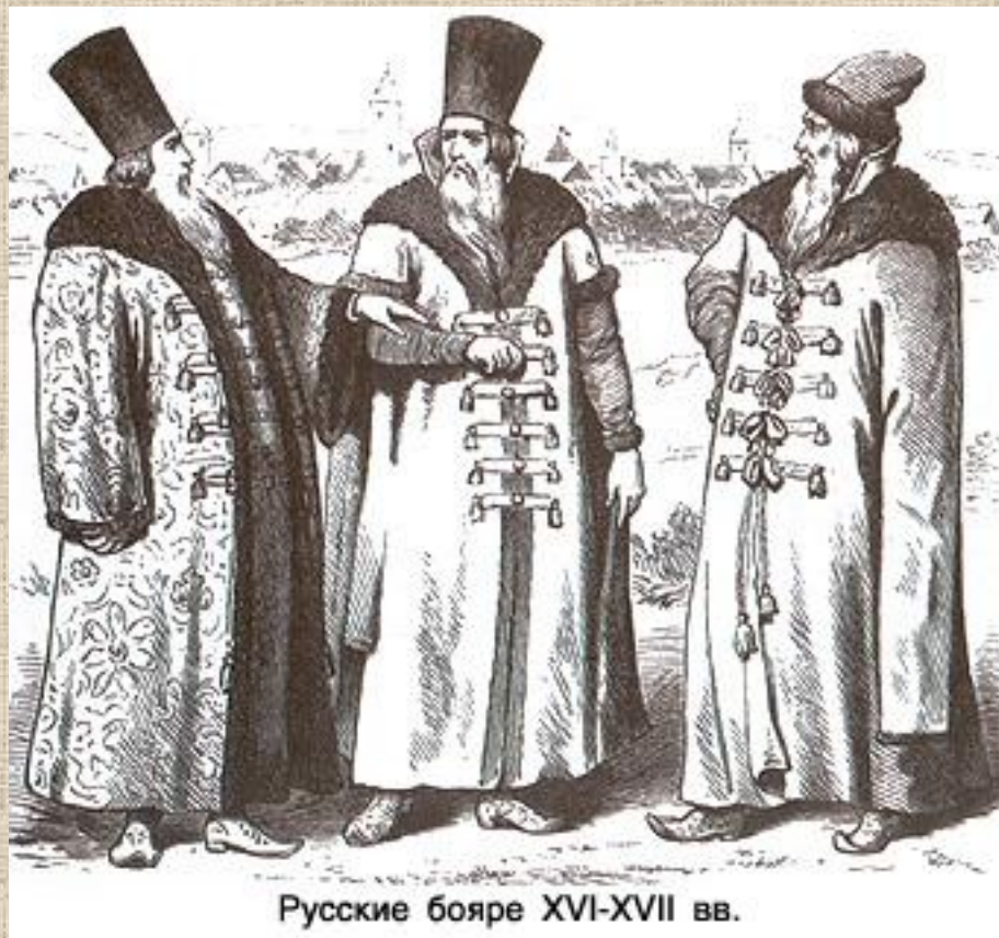
Русские бояре XVI-XVII вв.