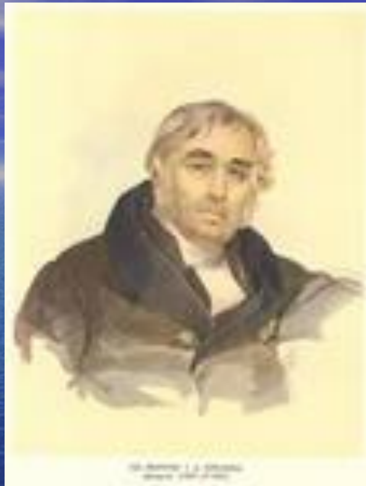
Иван Андреевич Крылов