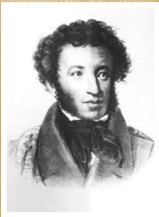
Пушкин Александр Сергеевич