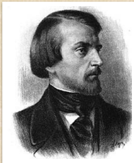
Белинский Виссарион Григорьевич