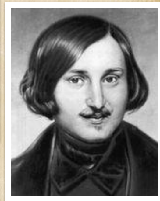
Гоголь Николай Васильевич