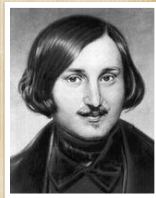
Гоголь Николай Васильевич