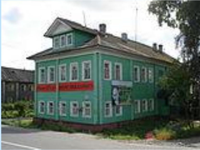
Дом, где родился Н.М. Рубцов

Николай Михайлович Рубцов родился 3 января 1936 в поселке Емецк Архангельской области; сын погибшего в войну политработника.