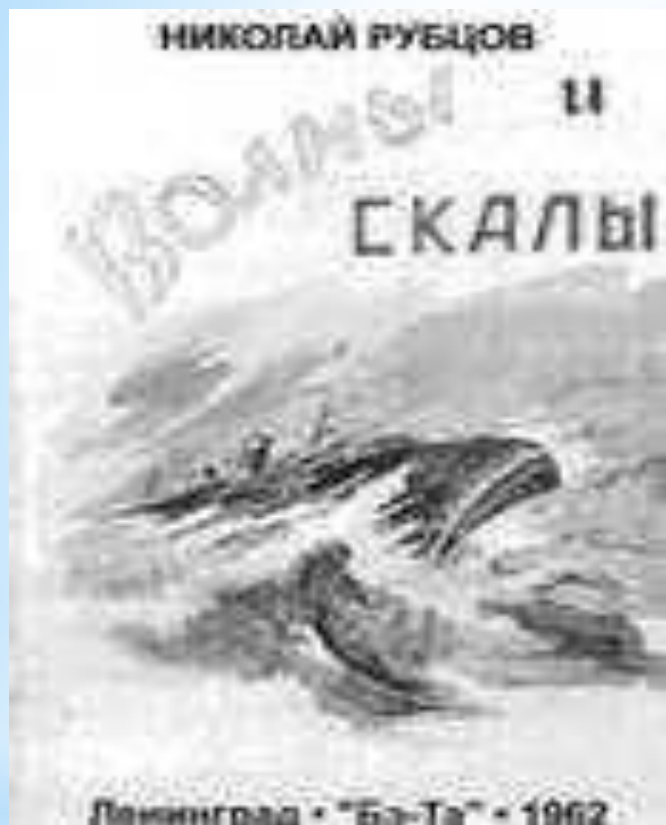
Обложка первого стихотворного сборника Рубцова

В августе 1962 года Рубцов поступает в Литературный институт им. М. Горького в Москве. Поэт продолжает писать, и в середине 1960-х у него выходят первые сборники. В 1969 году Рубцов закончил Литературный институт и был принят в штат газеты «Вологодский комсомолец». Вологодская «малая родина» и Русский Север дали Николаю Рубцову главную тему будущего творчества. Именно они стали центром его жизни, «землёй священной!», где он чувствовал себя «и живым, и смертным».