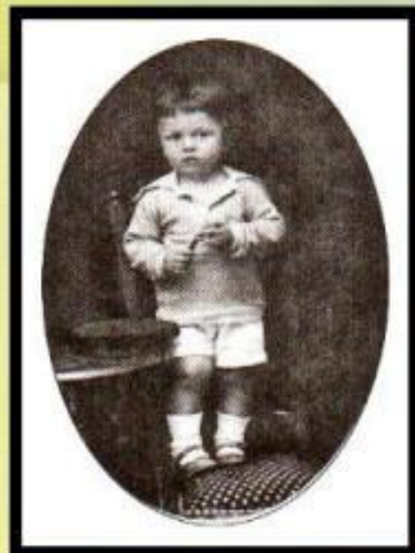
Борис Заходер 1920 г.