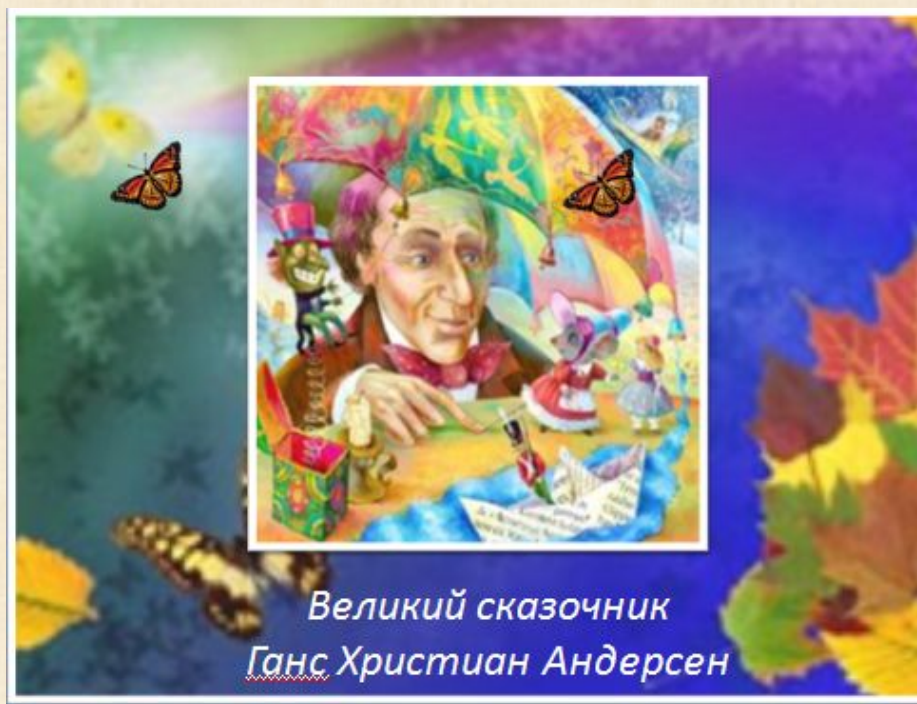
Великий сказочник Ганс Христиан Андерсен

«Нет сказок лучше тех, которые создаёт сама жизнь»