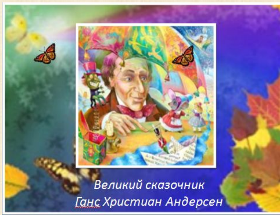
Великий сказочник Ганс Христиан Андерсен

«Нет сказок лучше тех, которые создаёт сама жизнь»