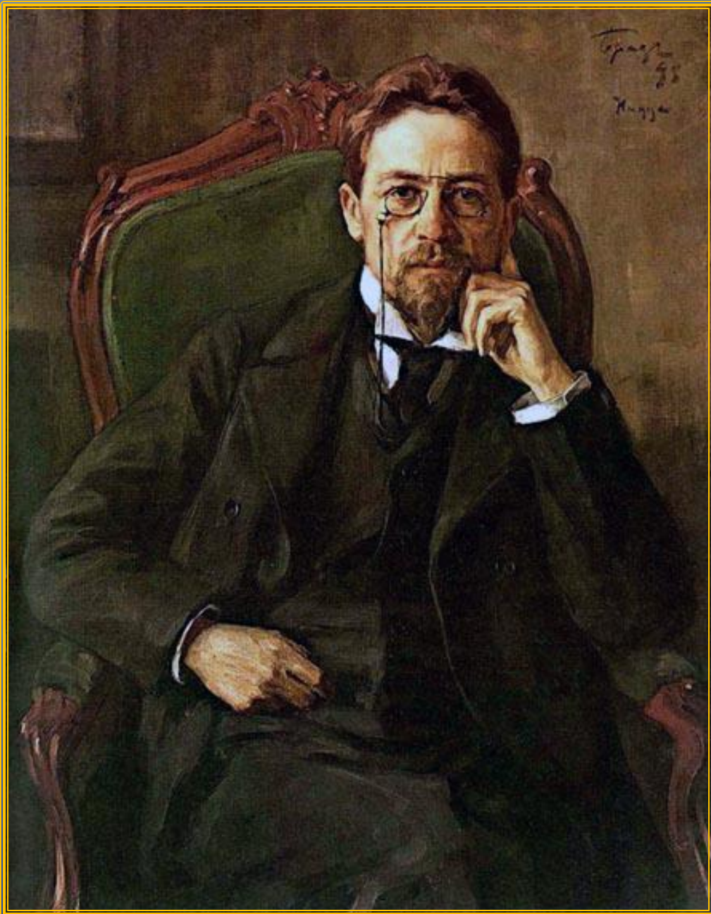
А.П. Чехов (1860 – 1904)