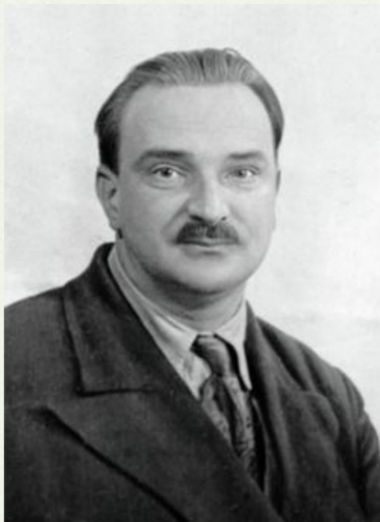
Виталий Валентинович Бианки (1894-1959)