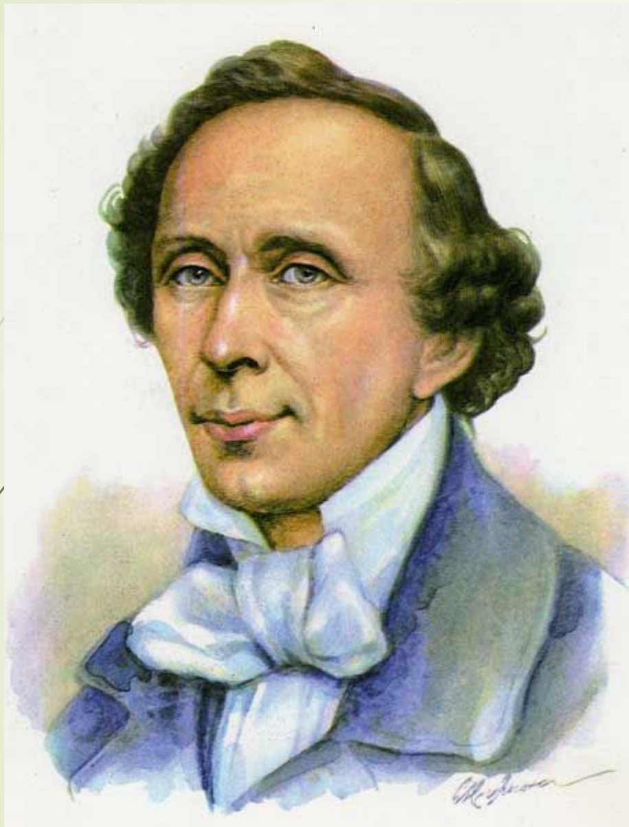
Г. Х. Андерсен