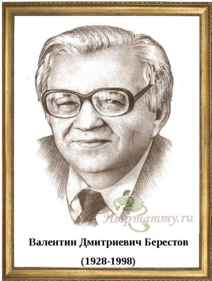
Валентин Дмитриевич Берестов (1928-1998)