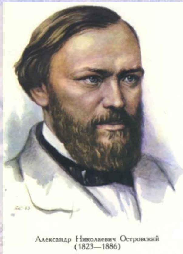
Александр Николаевич Островский (1823—1886)