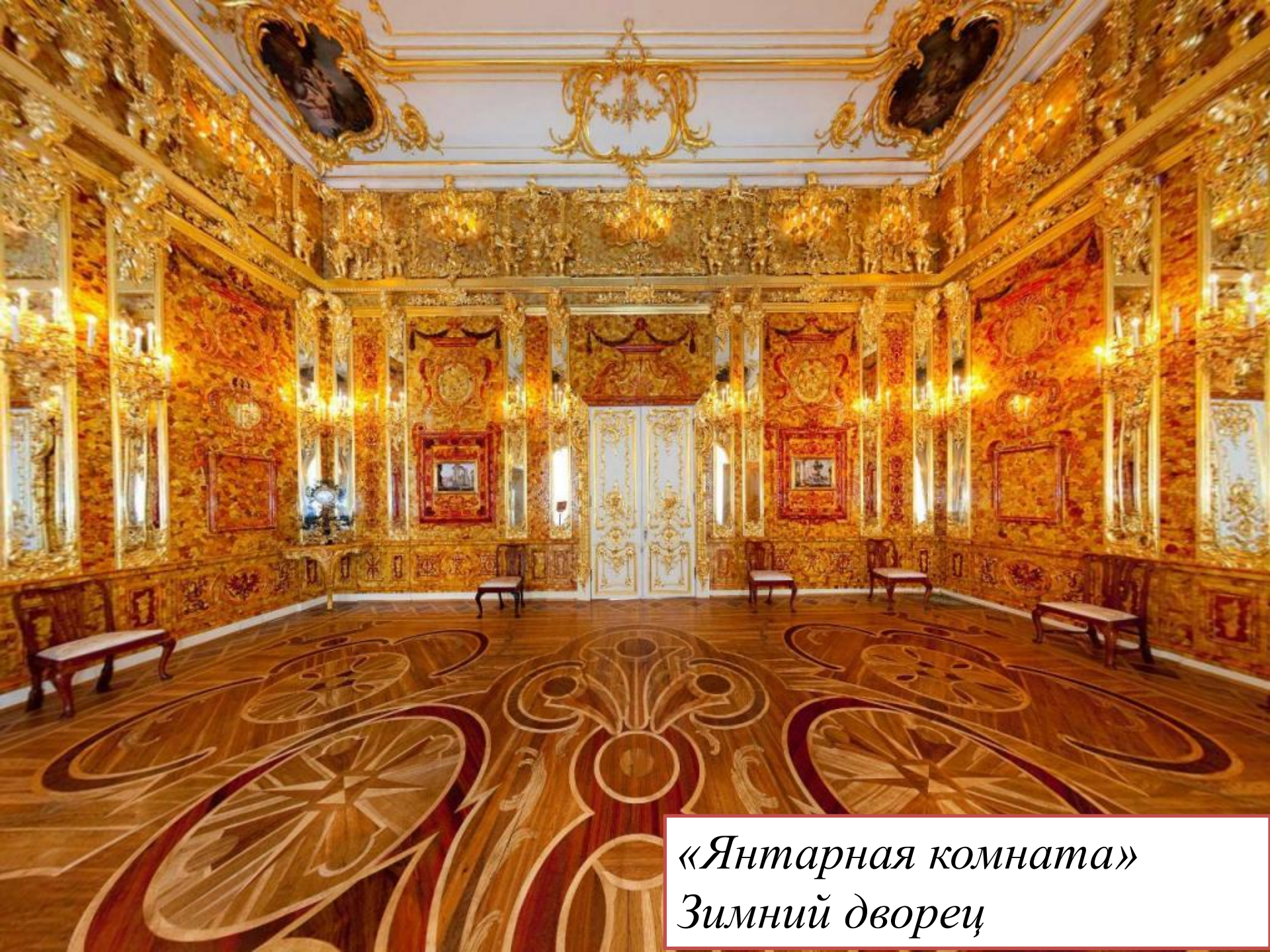
«Янтарная комната» Зимний дворец