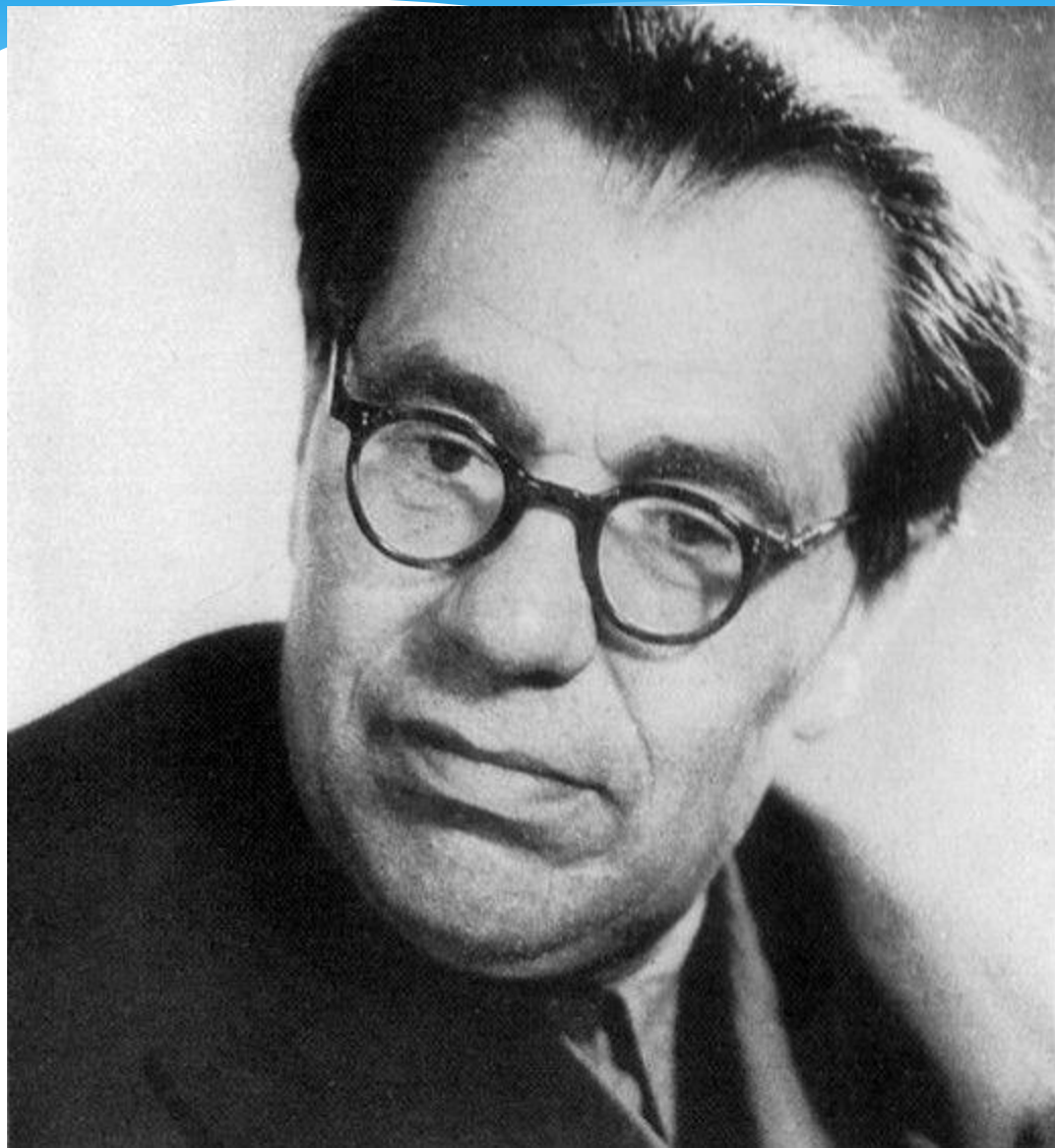
Николай Иванович Рыленков