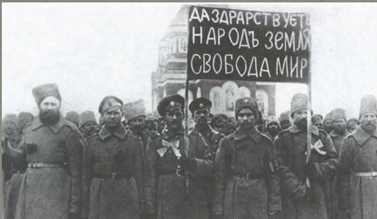
Революционные события 1917 г.

Одобрал и прославлял революционные события 1917 года, но позже разочаровался в происходящем. Осудил действия большевиков.