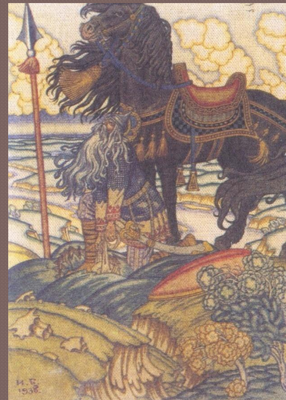
Святогор и перемётная сума