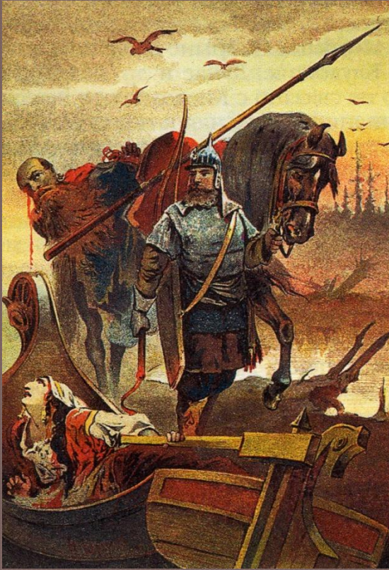
Илья Муромец и Соловей-разбойник