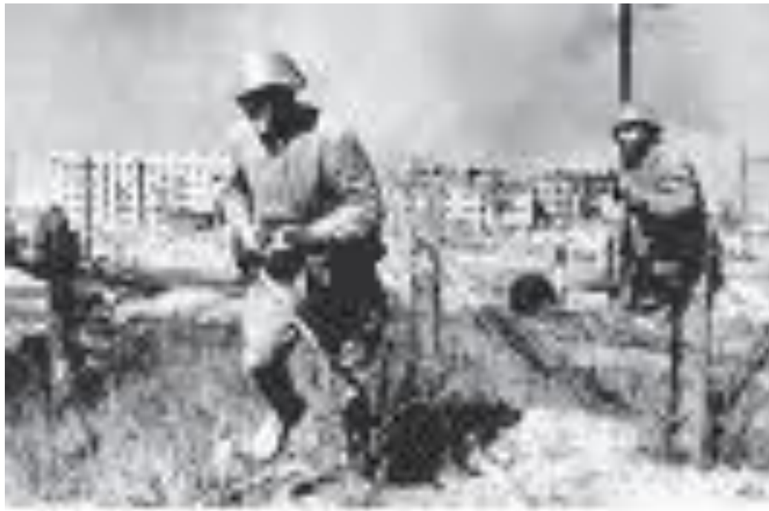
Солдаты, 1942 г.

В атаку пошла пехота- К полудню была чиста От убегающих немцев Скалистая высота.