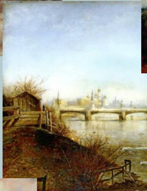
Вид на Кремль с Крымского моста