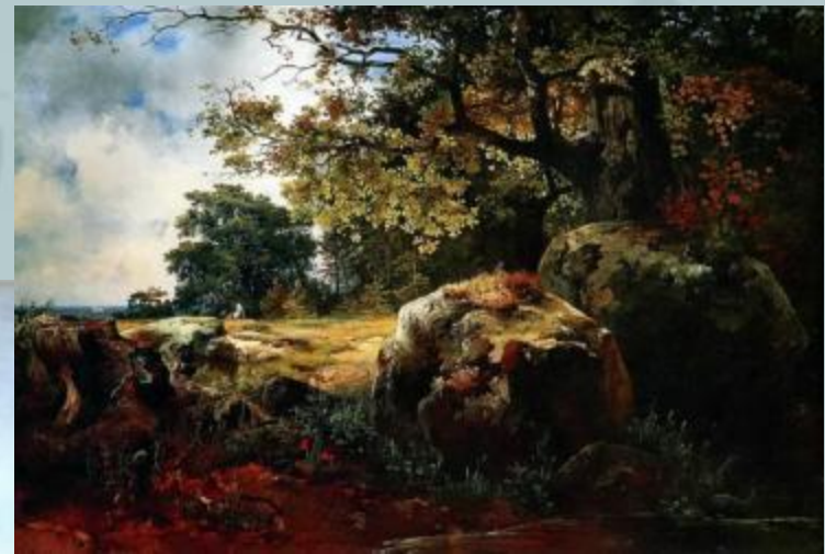
Вид в окрестности Ориенбаума