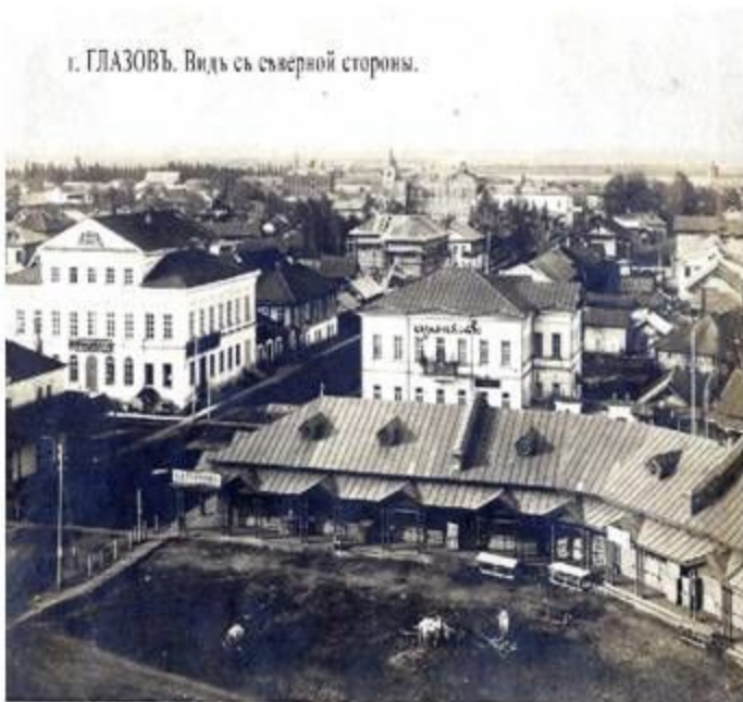
г. ГЛАЗОВЪ. Видъ съ сѣверной стороны.

Весной 1879 по подозрению в революционной деятельности Короленко вновь был исключен из института и выслан в Глазов Вятской губернии.