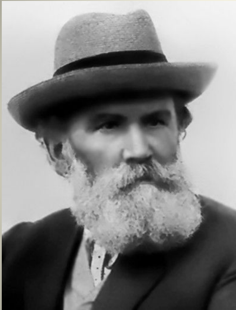
Владимир Галактионович Короленко