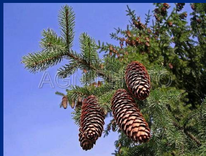
Богатая хвойными лесами