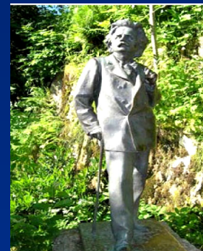
Где Дагни встретила Э. Грига