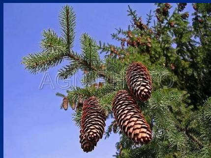
Богатая хвойными лесами