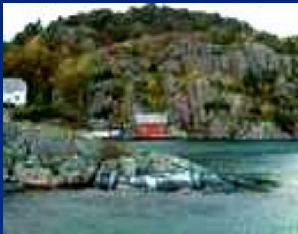
Это - Норвегия