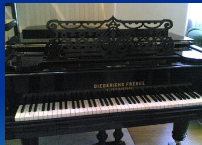
Он посвятил ей музыкальную пьесу