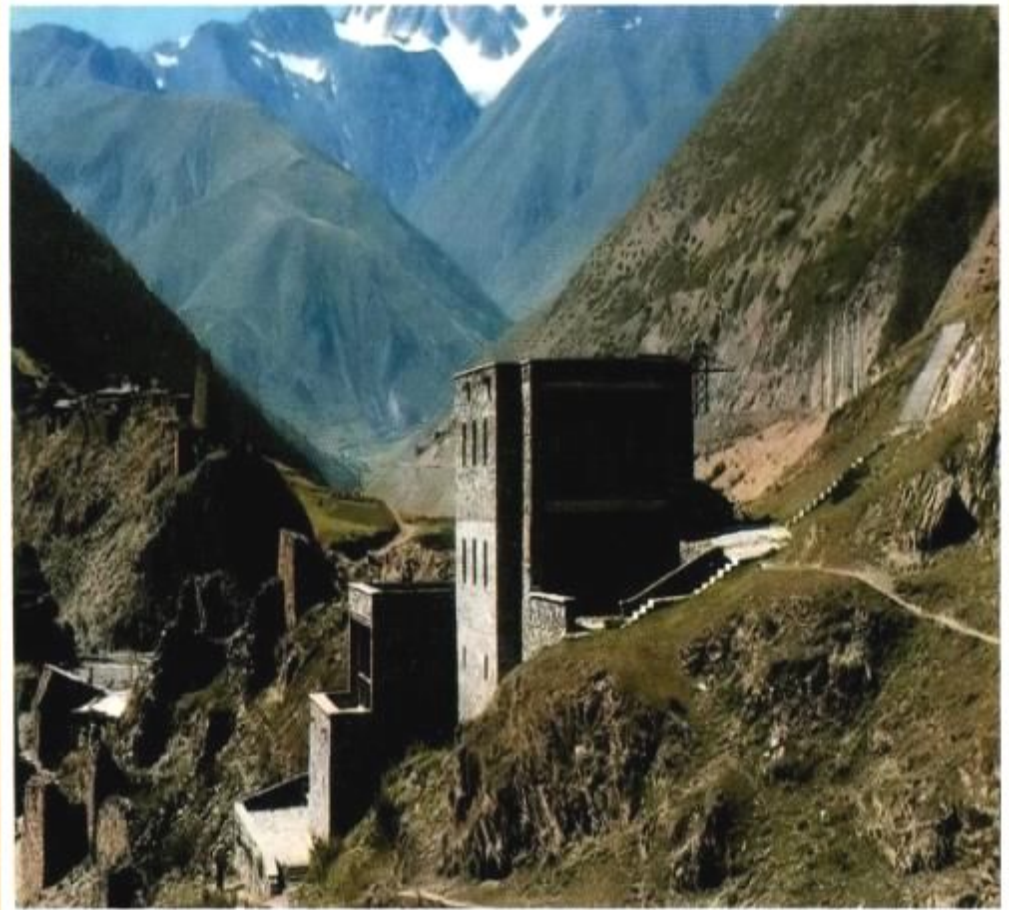
Аул Нар. Музей Коста Хетагурова