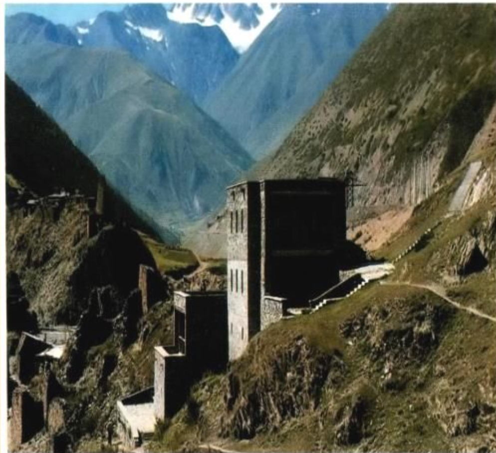
Аул Нар. Музей Коста Хетагурова