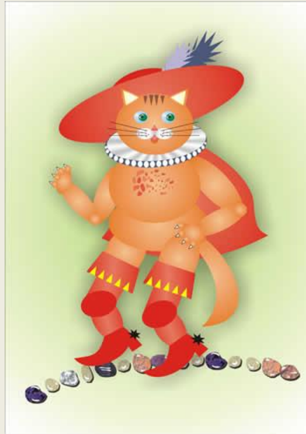
Кот в сапогах