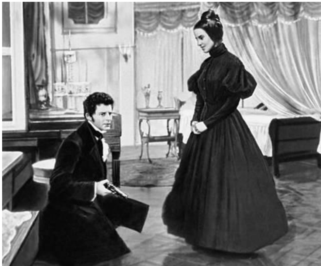
Кадр из фильма Отан-Лара Le rouge et le noir 1954 г.

Роман «Красное и черное», быть может, самый необыкновенный во французской литературе XIX века, прозвучал как грозное предупреждение: настанет время, когда Жюльены Сорели – молодые плебеи, умеющие пылко мечтать о лучшем будущем и бесстрашно бороться за свое счастье, - сумеют найти верный путь!