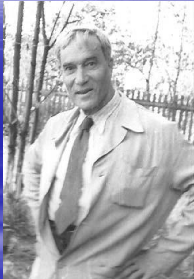
■ Б.Л. Пастернак (1890–1960).