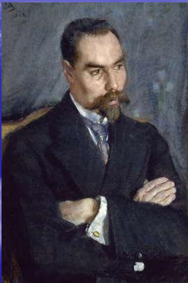
В.Я.Брюсов (1873–1924). Портрет работы С.В.Малютина. 1913 г.