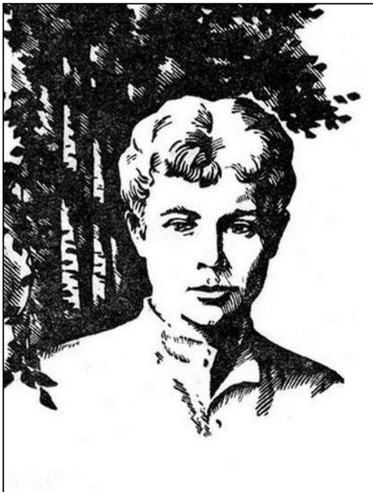
Сергей Александрович ЕСЕНИН – русский поэт (1895-1925)